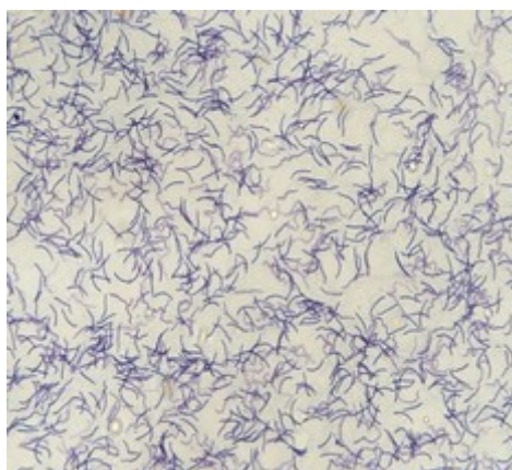
Figure 2: Papanicolaou staining of sperms in poultry (200 X)

Different superscripts in each column represent significant differences between groups ( P<0.05 ).