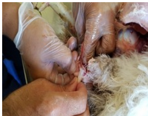
Figure 1: Sperm collection in examined poultry

در ارزیابی میکروسکوپی، حرکت دسته جمعی (توده-ای) اسپرم‌ها با استفاده از روش قطره‌گذاری روی لام، حرکت انفرادی اسپرم‌ها با استفاده از مشاهده‌ی مستقیم اسپرم‌ها زیر میکروسکوپ فاز کنتراست، غلظت و تعداد کلی اسپرم‌ها در واحد حجم با استفاده از لام Makler و درصد اسپرم‌های زنده با استفاده از رنگ‌آمیزی تریپان بلو تعیین و ثبت گردید. در نهایت، شاخص‌های بیولوژیک مورد بررسی و ارزیابی قرار گرفت. شاخص‌های بیولوژیک اسپرم که در این تحقیق مورد ارزیابی قرار گرفتند شامل تعداد اسپرم، تحرک کلی اسپرم، مورفولوژی نرمال اسپرم بودند. به منظور تشخیص دقیق ناهنجاری‌های سر، قطعه‌ی میانی و دم اسپرم از رنگ‌آمیزی پاپانیکولا نیز استفاده شد. لازم به ذکر است در صورت آلوده بودن نمونه‌ی منی با خون و یا هرگونه مواد مداخله‌گر دیگر، نمونه ۲-۳ بار با محیط Sperm wash شستشو داده شد و با دستگاه اسپرم فیوژ سانترفیوژ گردید.