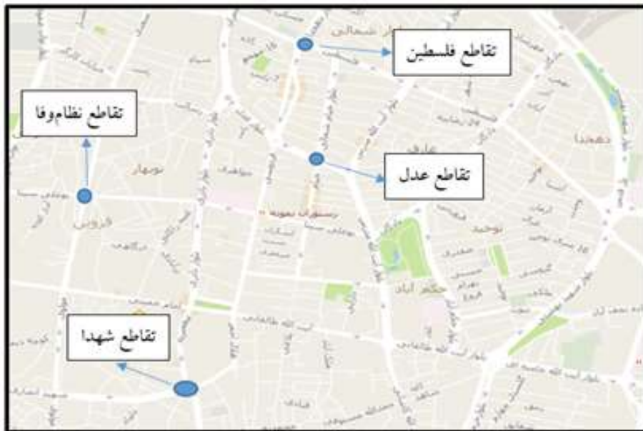
شکل ۲. موقعیت تقاطع های انتخاب شده در شهر قزوین