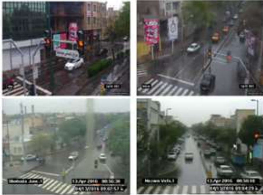
شکل ۱. تصاویر دوربین های نظارت تصویری مورد استفاده

علیرضا عبدالرزاقی، بابک میربهاء، امیرعباس رصافی