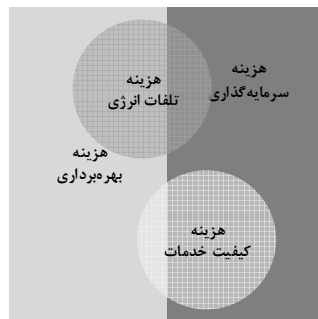
شکل (۱): دسته‌بندی هزینه‌های شرکت‌های توزیع الکتریکی

به منظور محک‌زنی جنبه‌های مختلف کارایی هزینه‌های شرکت‌های توزیع الکتریکی، این هزینه‌ها می‌توانند بر اساس اهداف اصلی هزینه‌ای دسته‌بندی شوند. دسته‌بندی هزینه‌های شرکت‌های توزیع الکتریکی در شکل (۱) نشان داده شده است.