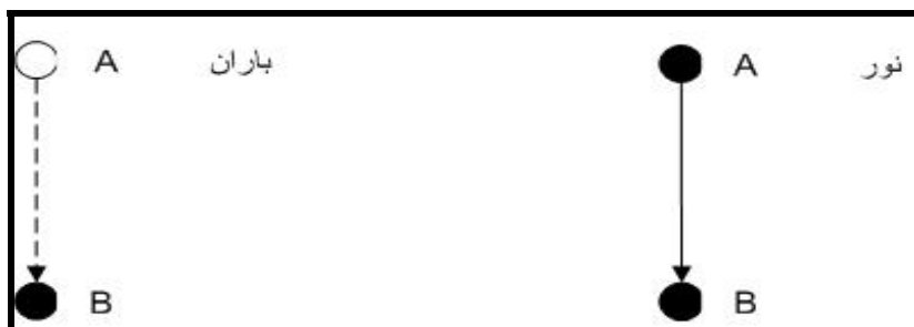
شکل (۱-۱): نزول بی تجافی و نزول با تجافی

وبالآخره اینکه قرآن به دلیل همین نوع نزول، فضایی چند لایه و چند بطنی دارد، که لایه‌های عمیق و بالای آن، وحدت و بسط‌دارند، درحالی‌که لایه‌های پایینی و سطحی آن کثرت و لفظ، و آنچه مهم است پیوستگی همه این لایه‌ها باهم است، چرا که نزول قرآن از نوع نزول بدون تجافی است، مانند نور که وقتی از نقطه A به نقطه B برسد، نقطه A را خالی نمی‌کند و این برای قرآن، این همانی ۴ ایجاد می‌کند، به خلاف نزول با تجافی، مثل باران که اگر قطره‌ای از نقطه A به نقطه B برسد، دیگر در نقطه A نیست: