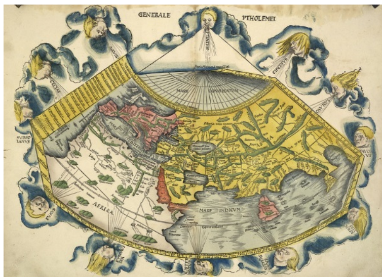
نقشه‌ی بطلمیوس (نک: هارت - دیویس، ۶۲/۱)

ویژگی مهم دیگری که از این دوره‌ی زمانی قابل اشاره است، نقشه‌ای از جهان است که گفته می‌شود بطلمیوس، آن را براساس تفکر مردم اسکندریه در سال ۱۲۰ میلادی، ارائه کرده است. همان‌گونه که در تصویر این نقشه دیده می‌شود، موجوداتی در اطراف زمین در حال دمیدن هستند که نتیجه‌ی آن ایجاد باد در زمین است (هارت - دیویس، ۶۲/۱). این تصویر، دلیلی بر رواج دیدگاه «مستقیم (یا افقی) بودن وزش بادهای» می‌باشد (نک: براتی و قطب‌شریف، ۱۶۶).