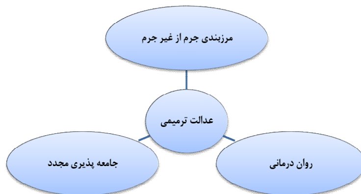
شکل شماره ۳: مفصل بندی گفتمان درمان و توان بخشی

گفتمان درمان و توان بخشی برخی از مفاهیم نظریات پارادایم بر ساخت گرا به ویژه نظریه برچسب زنی و نظریه های تضاد را بازتولید و راهکار پیشنهادی آنها را به کار می گیرد. پیشنهادات کنترلی نظریه برچسب زنی در قالب سیاست های منبعت از تغییر مسیر از نظام رسمی به نظام غیر رسمی شامل برچسب زدایی، رفع بدنامی، جرم زدایی، حبس زدایی، عدم مداخله، الگوها و برنامه هایی مانند قضای احیاگر، شرم بازگرداننده و همایش های گروهی و خویشاوندان هر کدام به نوعی در رویکردهای کنترلی این گفتمان نیز به چشم می خورد (سلیمی، ۵۲۱-۵۲۵).