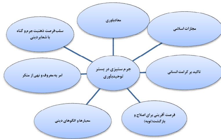
شکل شماره ۱: مفصل بندی گفتمان اسلامی کنترل جرم

طرفه وجود دارد. به این معنا که با عمل به شعایر دینی امکان ارتکاب به گناه (جرم) کاهش می‌یابد و کسانی که کمتر به گناه آلوده می‌شوند نفس و ذات دین را بهتر و بیشتر درک می‌کنند. امام صادق(ع) می‌فرماید: کسی که دوست دارد بداند نمازش مورد قبول پروردگار قرار گرفته است یا نه باید بنگرد که آیا نمازش او را از گناه و انحراف باز می‌دارد یا نه. به هر مقدار که نماز او را از فحشا و منکر باز دارد به همان اندازه از نمازش پذیرفته شده است (مجلسی، ۱۶).