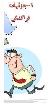
شکل ۱. فرایند پرداخت کوانتومی

به |\psi'\rangle = \frac{P_{a_j}|\psi\rangle}{\sqrt{\langle\psi|P_{a_j}|\psi\rangle}} تغییر خواهد داد و مقدار اندازه‌گیری شده برابر ویژه مقدار a_j با احتمال \langle\psi|P_{a_j}|\psi\rangle است.