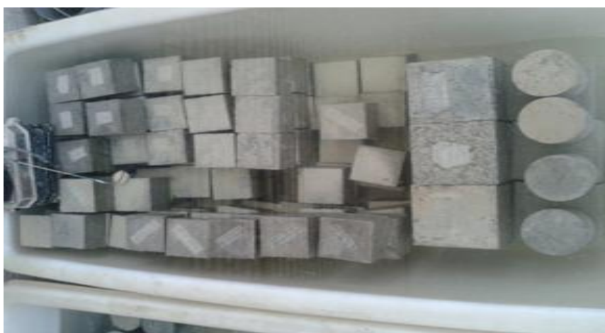
شکل ۴- نحوه عمل آوری نمونه‌های مکعبی و استوانه‌ای

بعد از ساخت نمونه‌های بتنی و ریختن آنها در قالب‌های مکعبی و استوانه‌ای به مدت ۲۴ ساعت در این قالب‌ها می‌مانند و بعد از ۲۴ ساعت نمونه‌ها را از قالب‌ها بیرون آورده و تمامی نمونه‌ها را در حوضچه آب معمولی ۲۰ درجه سانتیگراد جهت عمل آوری قرار می‌دهیم. پس از گذشت ۷ روز و عمل آوری در آب، ثلث اول نمونه‌ها در محیط آب معمولی، ثلث دوم در آب با ۵ درصد وزنی سولفات منیزیم و ثلث سوم در آب با ۱۰ درصد وزنی سولفات منیزیم مورد عمل آوری قرار گرفتند. برای ساخت محیط سولفات، به اندازه ۵ درصد و ۱۰ درصد وزن آب، سولفات منیزیم به آب اضافه می‌کنیم. لازم به ذکر است که به دلیل تغییرات PH آب در زمان طولانی، دو هفته یکبار، آب تشت تخلیه می‌شود و محیط سولفات دوباره ساخته می‌شود. پس از زمان عمل آوری بتن‌ها را از آب و محیط سولفات در آورده ابتدا وزن می‌نماییم سپس طبق آیین‌نامه به مدت یک روز در دمای ۲۰ درجه قرار می‌دهیم تا برای آزمایش مقاومت فشاری و کششی رطوبتی نداشته باشد. نمونه‌ها