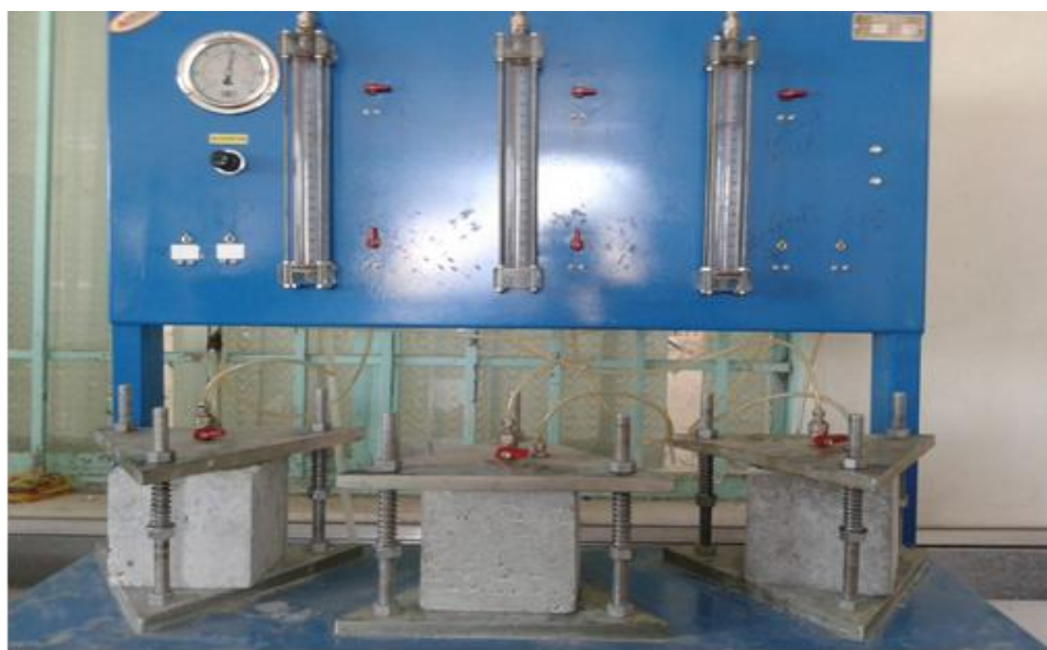
شکل ۳- دستگاه آزمایش نفوذپذیری نمونه های مکعبی

نفوذپذیری بتن معمولاً از طریق محاسبه مقدار آب تحت فشار که برای جریان یافتن به درون یک نمونه بتنی داخل می شود، در یک فاصله زمانی مشخص تعیین می شود. با اندازه گیری عمق نفوذ آب پس از شکستن نمونه ها می توان به معیاری برای نفوذپذیری بتن دست یافت. در روش اخیر بر اساس DIN1048 نمونه های مکعبی ۱۵*۱۵*۱۵ سانتیمتری بتن تحت فشار ثابت ۱۵ اتمسفر قرار