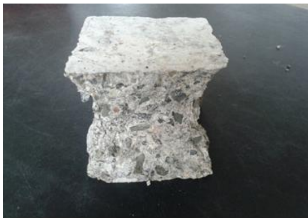
شکل ۲- نحوه شکست نمونه های مکعبی تحت آزمایش مقاومت فشاری

می گیرند. طبق استاندارد سطحی از نمونه که با فشار بر آن اثر می کند با برس سیمی کمی زیر می شود. پس از گذشت ۷۲ ساعت نمونه ها به دو نیم تقسیم شده و مقدار نفوذ آب اندازه گیری می گردد [۱۷]. در تعیین مقدار نفوذ آب در نمونه ها سعی شد تا عدد معرفی شده، میانگینی از مقادیر مختلف نفوذ آب در طول ۱۵ سانتیمتری بعد نمونه باشد. در این آزمایش نمونه ها ابتدا به مدت ۲۸، ۵۶ و ۹۰ روز در محیط آب شرب و محیط آب شرب با ۵ درصد و ۱۰ درصد سولفات عمل آوری شده، سپس مورد آزمایش نفوذپذیری قرار گرفته اند. در شکل ۳ دستگاه نفوذپذیری نمونه های مکعبی بتن خودتراکم و نحوه قرار دادن این نمونه ها آورده شده است.