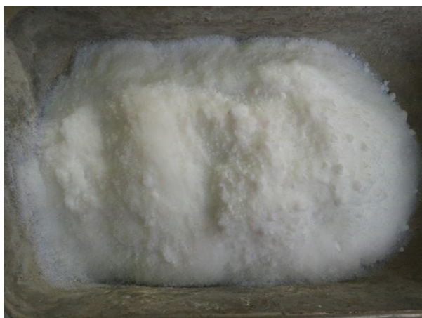
شکل ۱- نانوسیلیس

صورت پودری با ابعاد ۲۰ تا ۳۰ نانومتر و خلوص ۹۹ درصد و به رنگ سفید محصول شرکت پیشگامان نانو مواد ایرانیان در مشهد می‌باشد که شکل ظاهری این ماده در شکل ۱ آورده شده است.