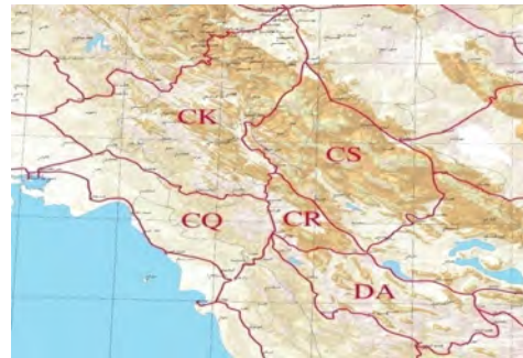
شکل ۱- لوپ ها و خطوط ترازیابی دقیق مورد استفاده در این تحقیق

اطلاعات کمکی نظیر داده های تفاضلی جوی و ثقل نقاط ارتفاعی در دسترس باشند.