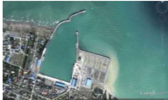
شکل (۲) نمایی از جانمایی فعلی بندر نوشهر.

در تحقیق حاضر به کمک مدل عددی مایک ۲۱، SW مراحل انتقال و انتشار امواج از آب عمیق به آب کم‌عمق و پای سازه برای شش حالت مختلف صورت گرفته است. این شش حالت با توجه به عدم قطعیت‌های موجود در نظر گرفته شده است. شبیه‌سازی برای دو ارتفاع موج و سه حالت تغییرات عمق آب در مجموع شش حالت را به وجود آورده است. جدول (۱) مشخصات شرایط مختلف هیدرودینامیکی را برای دوره بازگشت ۵۰ سال نشان می‌دهد. امواج برای دو ارتفاع ۸ و ۵/۵ متر با پریود به ترتیب ۱۲/۵ و ۱۱ ثانیه و همچنین برای دو حالت حدی تراز سطح آب و یک حالت متوسط تراز سطح آب انتشار داده شده است. نتایج مدل عددی نشان داده است که بازه تغییرات امواج در محدوده ۲/۱ تا ۴/۲ ثانیه متغیر بوده است. همچنین پریود میانگین امواج نیز بین ۹/۲ تا ۱۱/۵ ثانیه متغیر بوده است.