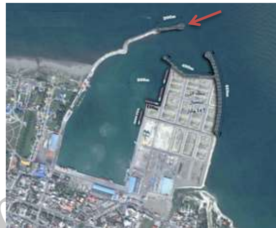
شکل (۳) نمای پیشنهادی برای طرح توسعه بندر نوشهر.