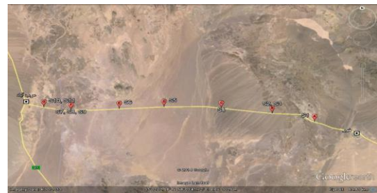
Fig. 1. Location map of sampling sites