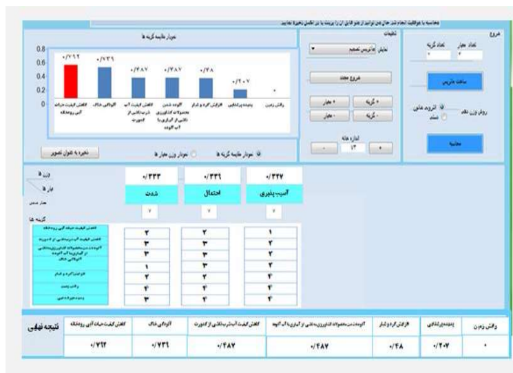
شکل (۲): ماتریس تصمیم گیری و نتایج اولویت بندی ریسک محیط فیزیکی شیمیایی فاز ساختمانی در نرم افزار Solver2014 TOPSIS