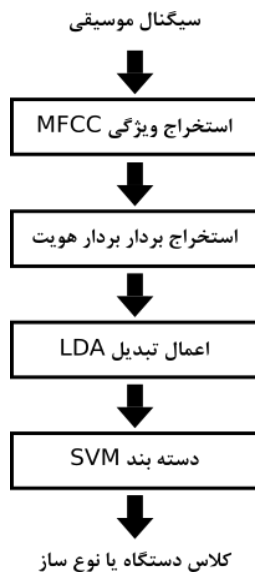
شکل ۲: نمای کلی سامانه پیشنهادی تشخیص دستگاه یا نوع ساز

در این بخش، به شرح سامانه پیشنهادی برای دو مسئله تشخیص دستگاه و تشخیص ساز ایرانی بر روی دادگان نوا می‌پردازیم. نمای کلی این سامانه در شکل ۲ آمده است.