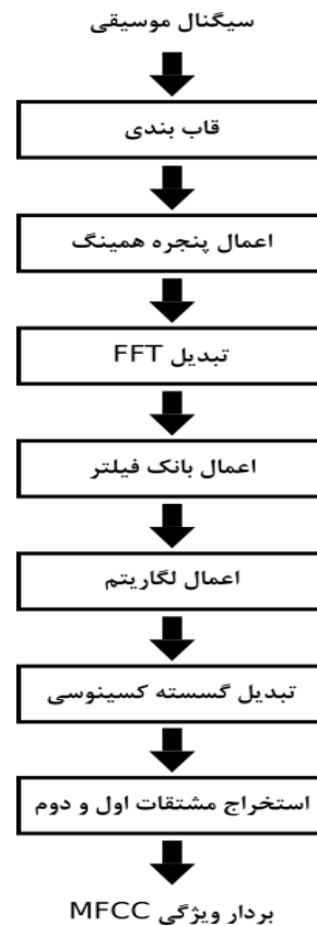
شکل ۳: مراحل استخراج ویژگی MFCC

طبقه‌بند ماشین بردار پشتیبان دسته‌بندی می‌شود. با لحاظ این که این سامانه با دادگان نوا آموزش داده شده و ارزیابی می‌شود؛ در صورتی که مسئله تشخیص دستگاه باشد، طبقه‌بند هفت دسته و اگر تشخیص ساز باشد پنج دسته خواهد داشت.