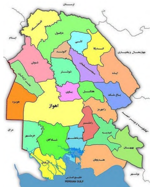
شکل ۱ موقعیت جغرافیایی محل مورد مطالعه

استان خوزستان در جنوب غربی کشور و در جایگاهی استراتژیک واقع شده است که از غرب با کشور عراق، از شمال با استان ایلام، از شرق با استان‌های چهارمحال و بختیاری و کهگیلویه و بویر احمد و از جنوب با آب‌های خلیج همیشه فارس هم مرز است. شهرستان اهواز مرکز سیاسی، اداری و تجاری استان خوزستان در موقعیت ۳۱ درجه و ۳۰ دقیقه عرض شمالی و ۴۸ درجه و ۶۵ دقیقه طول شرقی واقع است و بر اساس آخرین تقسیمات کشوری دارای پنج شهر به نام‌های اهواز، ملاتانی، شیبان، ویس و حمیدیه، سه بخش به نام‌های مرکزی، باوی و حمیدیه، دوازده دهستان و ۴۳۹ روستای دارای سکنه می‌باشد (شکل ۱). در قسمت‌های شمالی و مرکزی شهرستان اهواز،