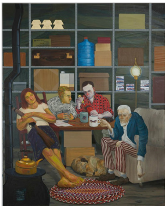
تصویر ۲. نیکول آیزمن، مهمانی چای، رنگ روغن روی بوم، ۲۰۱۱، مجموعه شخصی خانواده هویت (URL: 3)

نقاشی پیروزی فقر که در سال ۲۰۰۹ میلادی توسط نیکول آیزمن نقاش، چاپگر و مجسمه‌ساز آمریکایی معاصر با تکنیک