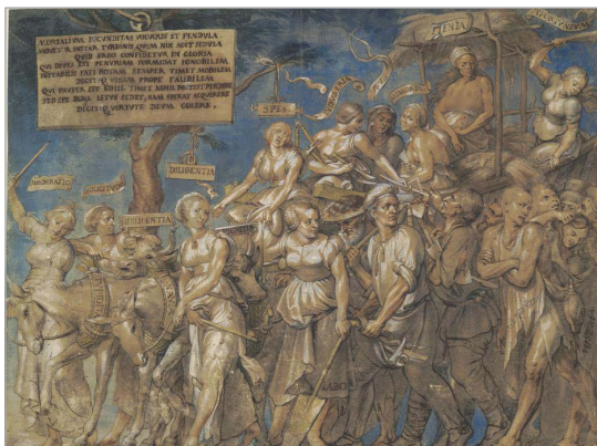
تصویر ۵. هانس هولباین، پیروزی فقر، مداد قهوه‌ای، گل‌باز قهوه‌ای و خاکستری، گچ قرمز، سیاه و سفید، ۱۵۳۴-۱۵۳۲، موزه بریتانیا، لندن (URL: 5)