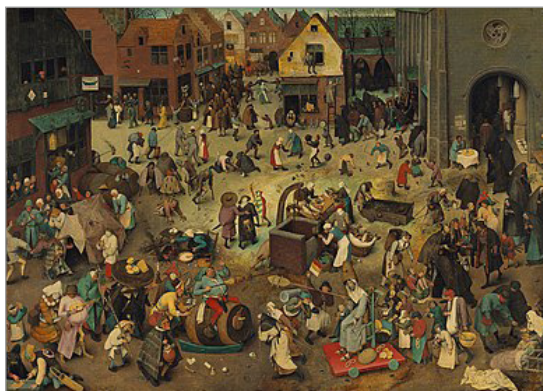
تصویر ۱۲. پیتر بروگل مهتر، نبرد میان کارناوال و لنت، رنگ روغن، ۱۵۵۹ (URL: ۱۱)

هم را به یکدیگر نزدیک می‌کند و با زیر پا گذاشتن مرزها مفاهیم مربوط به دوره‌های زمانی متفاوت را وادار به تبادلی سازنده می‌نماید، در خوانش اثر و پی بردن به نقد اجتماعی و سیاسی مطرح شده در آن ضروری است؛ اثری که زمان را متراکم کرده و از مخاطب می‌خواهد چنین تصور کند که در حال مشاهده افراد واقعی در حرکتی جمعی است. می‌توان گفت هنرمند با نزدیک کردن مقولات دور از هم در یک اثر هنری، هم امور را خودمانی کرده و از این طریق فروکاسته است و هم آنها را در معرض آشنایی‌زدایی قرار داده است. آمیختن کمدی و تراژدی در اثر را نیز می‌توان مانند خنده کارناوالی سمجی در نظر گرفت که در برابر دستورالعمل‌های نئوکلاسیک مقاومت می‌کند. در نهایت، مسئله اصلی تقابل کارناوال و لنت نیست، بلکه روبه‌رویی زندگی و مرگ است و پیروزی زندگی بر مرگ پیوسته با خنده کارناوالی بیان می‌شود.