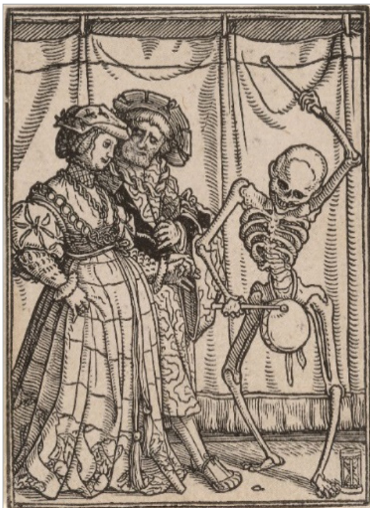
تصویر ۱۱. هانس هولباین جوان، نجیب‌زاده از مجموعه رقص مرگ، چوب نقش، حوالی ۱۵۲۶ (URL: 10)

است. چهره شخصیت‌های اثر از مرکز به سمت چپ تصویر، حاکی از افسردگی است که می‌توان آن را ناشی از نزدیک شدن به نماد لنتی اثر در نظر گرفت. همان‌گونه که کارناوال در تباین با لنت است، خنده و سرخوشی کارناوالی نیز در مقابل افسردگی لنتی قرار می‌گیرد. چهره‌های مسخ‌شده در اثر نیز زمینه‌ساز دگرگون‌سازی کارناوالی هستند. این مسخ موجب تغییر و احیای این شخصیت‌ها پس از کارناوال می‌شود. در کنار خانه سفیدرنگ در ۱/۳ بالایی تصویر، صورت رنگ‌پریده مردی با لباس رسمی قرار گرفته است که می‌توان با توجه نشانه‌های زمان چرخه‌ای در اثر و همچنین نقاشی "نبرد میان کارناوال و لنت" ۵۲ از پیتر بروگل مهتر، به خوانش آن پرداخت. در اثر بروگل که در سال ۱۵۵۹ نقاشی شده، هنرمند در پیش‌زمینه اثر، نبرد میان کارناوال و لنت را به صورت نزاع میان میخانه و کلیسا به تصویر کشیده است. گنبد در تحلیل خود ثابت می‌کند که این جنگ تمثیلی درباره زمان است و می‌توان آن را مانند تقویمی چرخه‌ای خوانش نمود (Gaignebet, 1972). در اثر بروگل، شاخه‌های درختان سمت چپ عریان هستند، در حالی که درختان سمت راست برگ دارند (تمثیلی از زمان چرخه‌ای) و بر خانه سفیدرنگ میان راه کلیسا و میخانه که محل انجام خانه‌تکانی بهاره است، دلکچ رنگ‌پریده عید پاک ۵۳ بر لبه پنجره نشسته و این چرخه