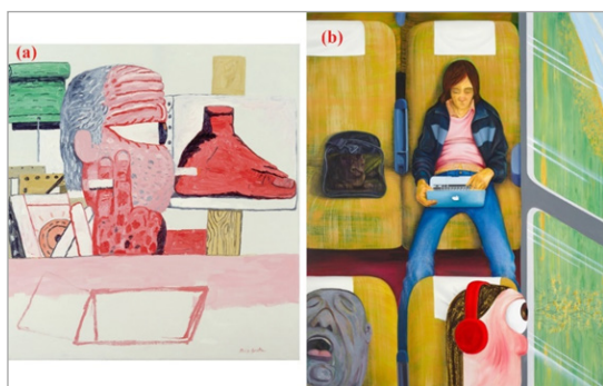
تصویر ۱. (a) فیلیپ گوستون، در استودیوی هنری، ۱۹۷۵، موزه هنر مدرن نیویورک و (b) نیکول آیزنمن، هفته‌ها در قطار، رنگ روغن روی بوم، ۲۰۱۵، مجموعه شخصی (URL: 2 URL: 1)

بسیاری از محققان به ذکر این مطلب پرداخته‌اند که او مضامین و نقش‌مایه‌های هنری خود را از فیلیپ گوستون ۲۸ گرفته است؛ مخصوصاً بدشکلی و دفرمه شدن اندام‌ها و سر لوبیا شکل قرمز رنگ با یک چشم بزرگ (تصویر ۱). مکالمه آیزنمن با تاریخ هنر بیش از آنکه مطابق با عرف انجام شود، کنجکاوانه و از روی عشق و علاقه صورت می‌گیرد (Yau, 2016). او در آثار خود بین ژانرهای مختلف هنری و مضامین اجتماعی، فرهنگی، سیاسی، عاطفی و احساسی بدون هیچ‌گونه تلاش یا تردیدی جابه‌جا شده و تغییر جهت می‌دهد. به‌عنوان