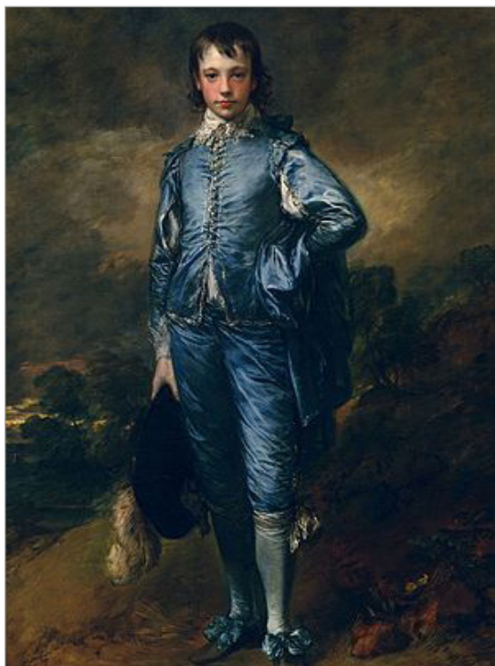
تصویر ۹. توماس گینزبارو، پسر آبی، رنگ روغن، حوالی ۱۷۷۰، کتابخانه هانتینگتون، کالیفرنیا (URL: 8)

از شاخصه‌های هنر گروتسک مردمی هستند اشاره دارد و بیانگر مرگ در پیوندی مشترک با طبیعت است. در کارناوال زمین دیوی است که خون تازه می‌نوشد و شخصیت مادری فرزندکش و آدم‌خوار به آن نسبت داده می‌شود، اما مرگ کارناوالی هرگز دراماتیک نبوده، بلکه موجب نوسازی و حیات دوباره می‌شود. غلات ترسیم‌شده در گوشه پایینی و سمت چپ اثر از طریق حرکت چشم با این فرم دوپلو و گروتسک مرتبط شده و به دانه‌هایی اشاره دارد که درو، خرمن کوبی و آسیا می‌شوند تا آرد تهیه شود و مردم از نان آن تغذیه کنند. مرگ انسان و دانه‌های درو شده در کارناوال، دربردارنده زندگی و بقای جمعی هستند.