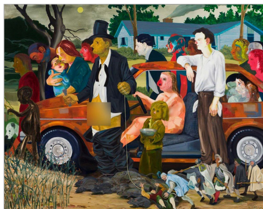
تصویر ۳. نیکول آیزمن، پیروزی فقر، رنگ روغن روی بوم، ۲۰۰۹، مجموعه شخصی بایی و استفن روزنتال، نیویورک (URL: 4)