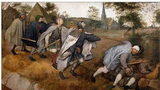
تصویر ۶. پیتر بروگل مهتر، کوری عصاکش کور دگر، تکنیک بی‌چسب رنگ ۱۴ ، ۱۵۶۸، ناپل، ایتالیا (URL: 7)