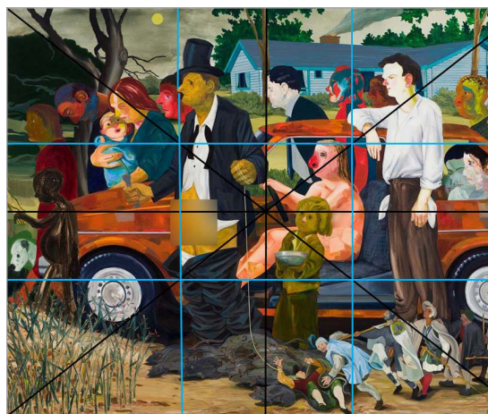
تصویر ۴. تقسیمات هندسی اثر پیروزی فقر (URL: 4)

نحوه فرارگیری عناصر و شخصیت‌ها در اثر بر طبق قانون یک سوم است و تصویر به‌طور ذهنی با دو خط موازی عمودی و افقی به نه قسمت مساوی تقسیم می‌شود که عناصر مهم تصویر در کنار این خطوط یا تقاطع آنها قرار گرفته و توجه بیشتری را به خود جلب می‌کنند. رابطه و نسبت عناصر و شخصیت‌ها به صورت پلکانی و در جهت خارج کردن اثر از تقارن است. حالت چهره شخصیت‌ها به صورت ماسکه‌شده و مسخ‌شده با به‌کارگیری رنگ‌های خنثی، رنگ‌های دارای بیان اکسپرسیو و گاهی ملون است. به‌کارگیری کنتراست‌ها و تن‌های بسیار قوی و شدید در عناصر کوچک‌تر اثر، عناصر بزرگ‌تر با تن‌های سبک‌تر را تحت تأثیر قرار می‌دهد و ترکیب‌بندی