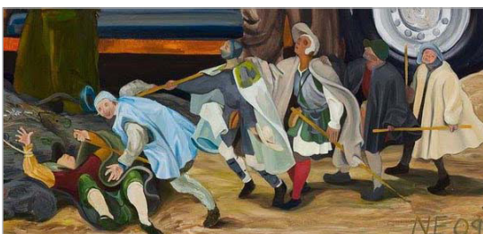
تصویر ۷. بخشی از اثر پیروزی فقر (URL: 4)