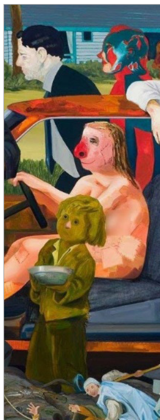
تصویر ۱۰. بخشی از اثر پیروزی فقر (URL: 4)

در اثر پیروزی فقر، عشق بی‌پرده میان شخصیت زن کارناوالی و مرد پیشرو و همچنین نماد مرگ در اثر (مرد بلندقامت با سر خمیده که به درخت خشکیده پیوند خورده است) را می‌توان به ایدئولوژی آیین مرگ در نیمه دوم قرن پانزدهم پیوند داد؛ آیین مرگی که در نقاشی‌ها و نگاره‌ها تصاویر عشق، شادمانی و مرگ را در کنار هم قرار داده و آنها را به هم ربط می‌دهد و تا دوره رنسانس نیز ادامه داشت (نولز، ۱۳۹۳: ۱۲۱). اثر چوب‌نقشی با عنوان "نجیب‌زاده" ۴۶ از مجموعه "رقص مرگ" ۴۵ از هانس هولبااین جوان که مربوط به حدود سال ۱۵۲۶ است، زن و مردی را نشان می‌دهد که در حالی که مرگ در جلوی آنها بر طبل کوچک جشنواره می‌کوبد، توجه آنها معطوف به یکدیگر است. در این اثر نیز شخصیت زن کارناوالی و مرد پیشرو بدون توجه به سیر خطی تراژیک اثر به سمت مرگ، سیه‌روزی و فقر، به این حرکت جمعی ادامه می‌دهند. نگاره‌های رقص مرگ اصولاً بر تباهی نهایی جسمانی تمرکز دارند، اما کارناوال نوسازی و زندگی دوباره جسمانی بر روی زمین را مد نظر قرار می‌دهد و آن را جشن می‌گیرد. آیزنمن معمولاً از این نماد مرگ احیاگر در تصاویر جشن و شادمانی خود استفاده می‌کند. مطرح کردن زندگی و مرگ در کنار هم، بیانگر این مسئله است که مرگ، تولد و