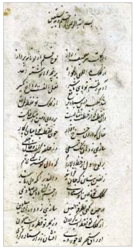
تصویر ۱. آغاز رساله آداب‌الخط از مجنون رفیعی، محفوظ در کتابخانه دانشگاه لوس آنجلس (ش ۳۷۳) (نگارنده)

رسالات خوشنویسی، از منابع دست اول پژوهش‌های خوشنویسی و هنرهای وابسته به آن به‌شمار می‌روند. از این‌رو، بررسی صحت و سقم نسخه‌های خطی و همچنین انتساب و تصحیح آنها باید با دقت بسیار انجام شود. در اینجا، متون تاریخی، رسالات و مقدمه مرقعات نفیس از اواخر سده نهم هجری و مقارن با دوره جوانی میرعلی و مجنون تا سده