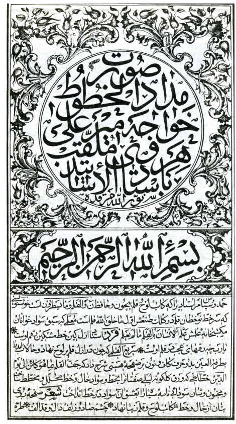
تصویر ۴. صفحه آغاز رساله ممدادالخطوط، تذکره الخطاطین میرزا سنگلاخ (نگارنده)