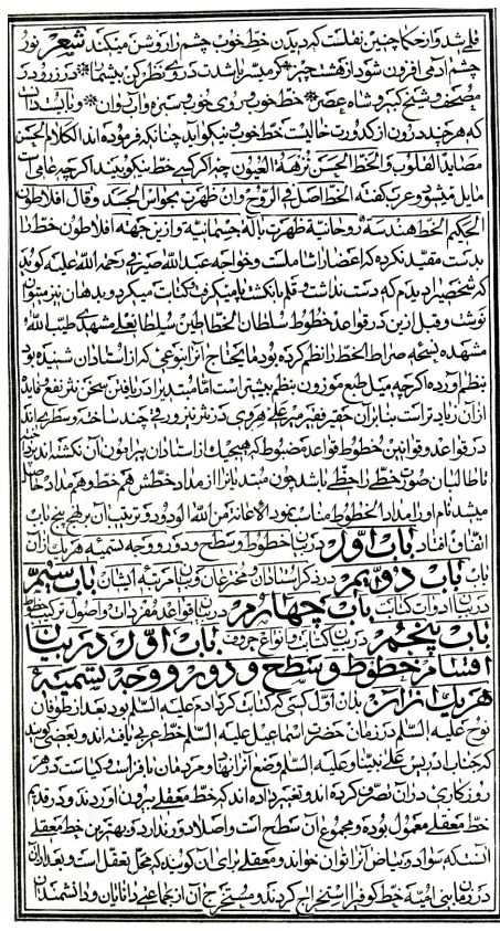
تصویر ۵. صفحه سوم از رساله ممدادالخطوط، تذکره الخطاطین میرزا سنگلاخ (نگارنده)

برای اطمینان بیشتر با مراجعه به تارنمای آقابرگ (بانک اطلاعات نسخه‌های خطی) (URL: 1) و جست‌وجوی کلیدواژه "ممدادالخطوط"، نسخه‌ای از رساله که مؤلف آن میرعلی هروی باشد و به پیش از سده سیزدهم هجری مربوط شود، یافت نشد؛ اما با جست‌وجوی "خط و سواد"، به بیش از ده دست‌نویس از سده یازدهم تا سیزدهم در کتابخانه‌های گوناگون می‌رسیم.