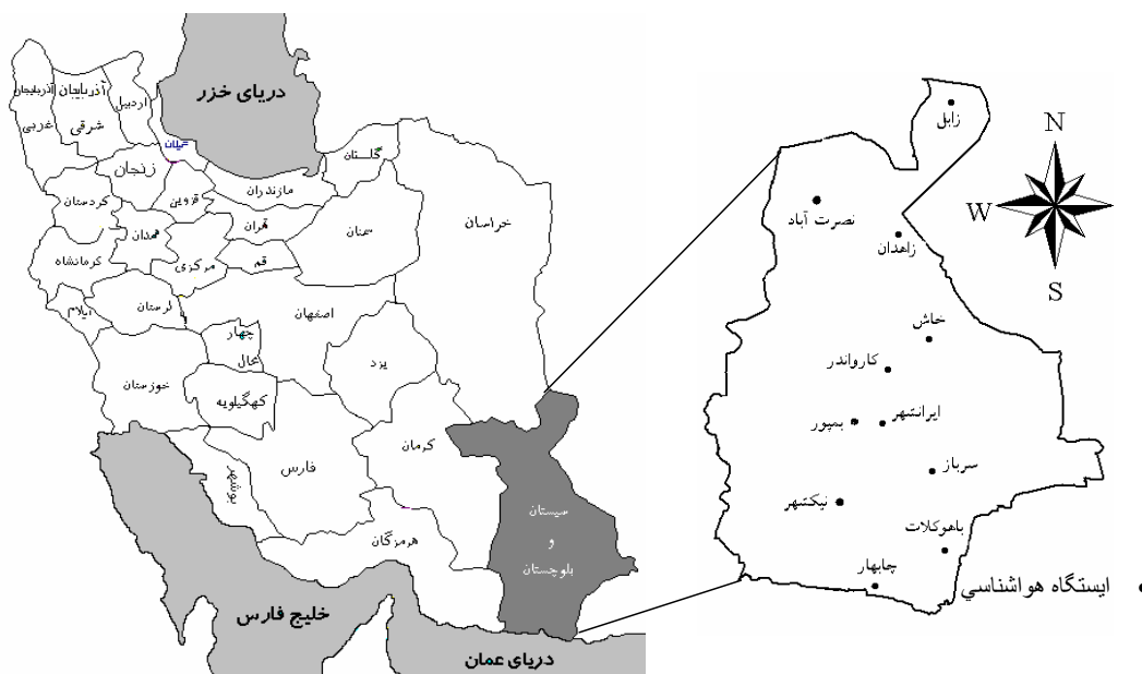
شکل ۱- موقعیت استان سیستان و بلوچستان در جنوب شرقی ایران و پراکنش ایستگاه‌های هواشناسی در آن

منشاء اصلی بارندگی‌های جنوب شرق ایران عمدتاً سامانه‌هایی هستند که در فصل سرد سال در بستر بادهای غربی به این منطقه وارد می‌شوند. تفاوت بین سالی در فراوانی سامانه‌های مدیترانه‌ای موثر بر استان، باعث می‌شود که بارندگی‌های این منطقه از سالی به سال دیگر متفاوت و ضریب تغییرات آن افزایش یابد. سامانه‌های مدیترانه‌ای زمانی به سیستان و بلوچستان می‌رسند که از نظر مقدار رطوبت دچار فرسودگی شده و توان کافی برای ایجاد بارش در این استان را ندارند و بارندگی اندکی را سبب می‌شوند. به همین علت میزان بارندگی سالانه ایستگاه‌های این استان در اغلب سالها کمتر