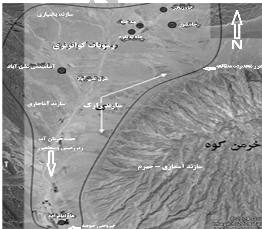
شکل ۱- سازندهای زمین‌شناسی و حدود محدوده مطالعه در غرب خرمن کوه فسا

تعداد ۱۵ منبع آب انتخاب و از اردیبهشت سال ۱۳۸۷ تا فروردین ۱۳۸۸ بطور ماهانه نمونه برداری شدند. مقدار نیترات آب با روش رنگ سنجی به وسیله اسپکتروفوتومتر و مقدار EC با استفاده از هدایت سنج الکتریکی، در محل اندازه‌گیری شدند.