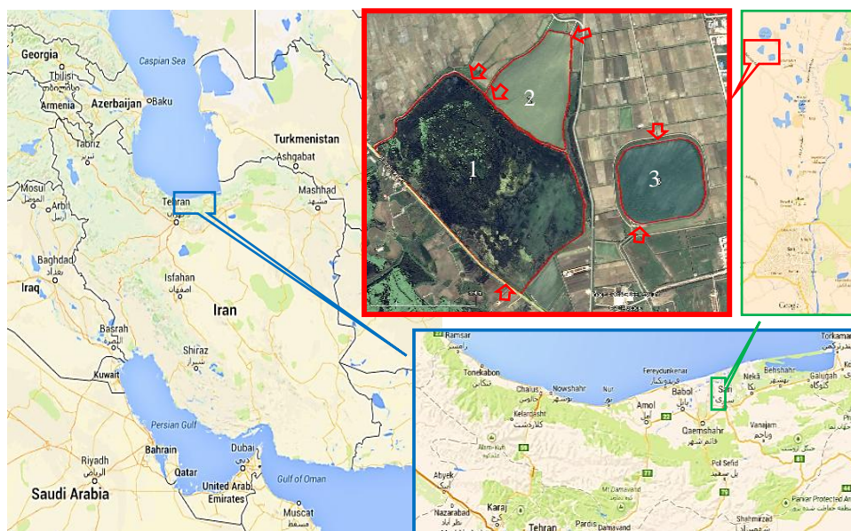
Fig. 1- Study area and the three Abbandan; 1: Sar-Abbandan; 2: Nobbor, 3: Lalle-Marz شکل ۱- محدوده مورد مطالعه؛ ۱: سرآببندان، ۲: آببندان نوبور و ۳: آببندان للمرز