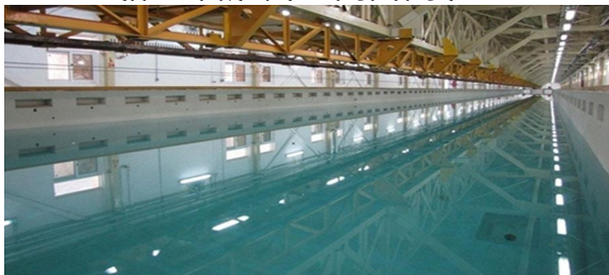
Fig. 2- Kousar Channel where the FATS evaluation was conducted

شکل ۱- نحوه‌ی قرارگیری ترانسدوسرها و پردازنده‌ها در رودخانه