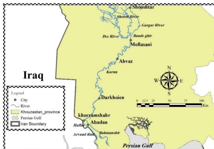
Fig. 1- Location of the Karun River