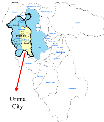
Fig. 2a- Subbasins of Urmia Lake Basin شکل ۲الف- نقشه زیرحوضه‌های حوضه آبریز دریاچه ارومیه