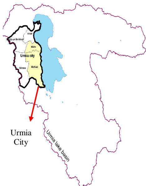
Fig. 2b- Location of central and Nazlu Districts in Urmia County شکل ۲ب- موقعیت بخش‌های مرکزی و نازلو روی نقشه شهرستان ارومیه

۲-۲- روش برآورد کارایی فنی آب آبیاری و کارایی فنی هزینه آب تکنولوژی تولید با استفاده از تابع مرز تصادفی زیر تعریف شود (Karagiannis et al., 2003):