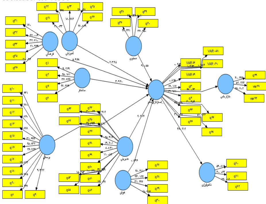
شکل ۱- ضرایب مسیر و بارهای عاملی

ضرایب بارهای عاملی بالاتر از ۰/۵ است پس مدل اندازه‌گیری پایایی مورد قبول را داراست.