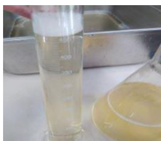
تصفیه و شفاف سازی (رفع کدورت)