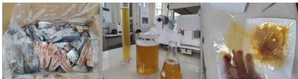
شکل ۷- مراحل استخراج ژلاتین ماهی هور.

ژلاتین از سر ماهی هور: بازده آن ۱۵۳ گرم به صورت خشک آسیاب شده از ۵ کیلوگرم سر ماهی