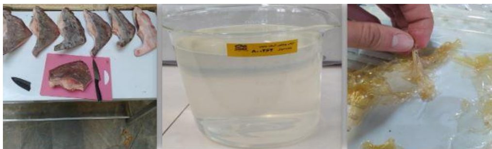
شکل ۳- مراحل استخراج ژلاتین باله سفره ماهی.

ژلاتین از باله سفره ماهی: استخراج از باله سفره ماهی انجام شد و راندمان کلی از کل باله خرد شده سفره ماهی ۱ درصد بود. این ژلاتین کاملاً بی‌رنگ و دارای بوی کمی از گوشت پخته باله بود. لازم به ذکر