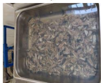
مرحله پخت و استخراج