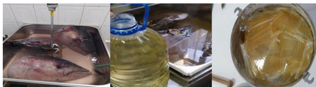
شکل ۸- مراحل استخراج ژلاتین ماهی گیدر.

ژلاتین از سر ماهی گیدر: ژلاتین خشک شده از سر ماهی گیدر ۲۰۰ گرم از ۵ کیلوگرم سر ماهی گیدر