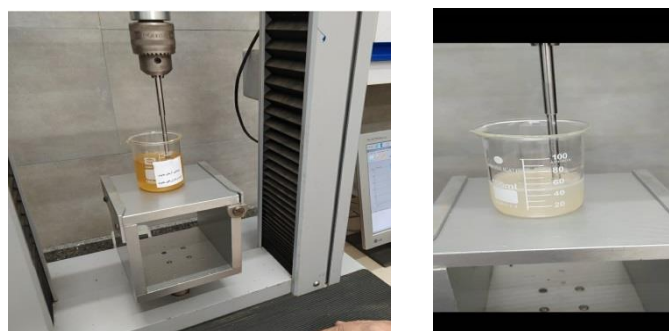
شکل ۱- تعیین مقاومت ژلاتین (ژل پوست ماهی خاویاری و ژل سر ماهی گیدر). Figure 1. Determination of gelatin resistance (sturgeon skin gel and gilder gel).

آب مقطر، ۱۰۰ گرم به صورت پودری بوده و راندمان کلی از این ماهی در این مرحله ۳/۳ درصد می‌باشد.