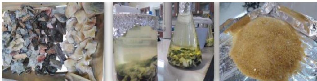
شکل ۶- مراحل استخراج ژلاتین پوست فیل ماهی.

ژلاتین از پوست فیل ماهی: راندمان استخراج ژلاتین از ۵ کیلوگرم پوست به تنهایی بدون گوشت ۹۱ درصد بود. ژلاتین استخراج شده بدون بو و مزه و دارای