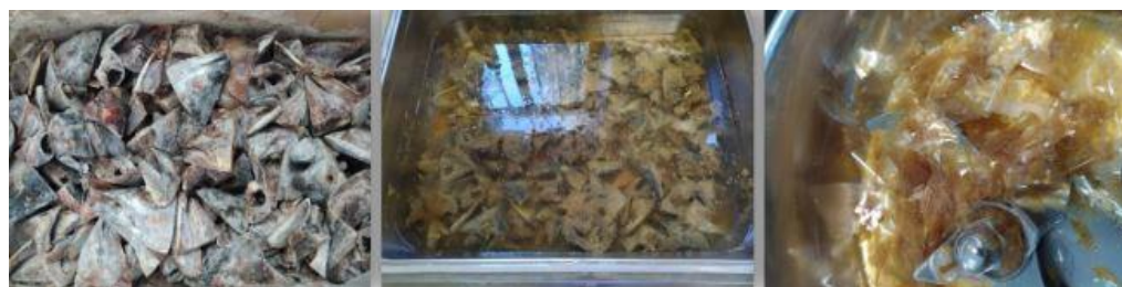
شکل ۴- مراحل استخراج از سر ماهی شیر.