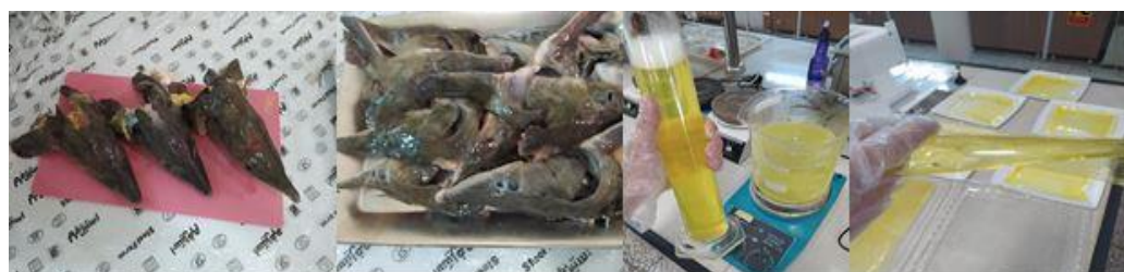
شکل ۵- مراحل استخراج ژلاتین سر فیل ماهی.

ژلاتین از سر فیل ماهی: مقدار ژلاتین به دست آمده و خشک شده از ۲ کیلوگرم سر فیل ماهی، ۳۴۰ گرم بود که نسبت راندمان آن ۱۷ درصد محاسبه شد. ژلاتین