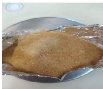
ژلاتین پودر شده (۴۹ گرم)