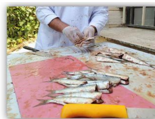
تخلیه امعا و احشا