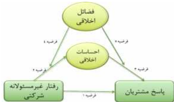
نگاره ۱. مدل مفهومی پژوهش

همچنین نقش میانجی احساسات اخلاقی در رابطه بین رفتار غیر مسئولانه شرکتی و پاسخ مشتریان می‌باشد. در نگاره ۱ مدل مفهومی پژوهش ارائه شده است.