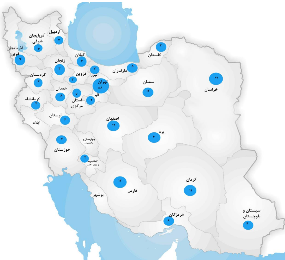
نگاره ۱. مقایسه استان‌های کشور بر اساس مقالات ارسالی به فصلنامه اخلاق در علوم و فناوری در سال ۱۳۹۷

بالاترین تعداد مقالات دریافتی به ترتیب از دانشگاه‌های استان های؛ تهران، خراسان، فارس، اصفهان و سمنان بوده‌اند (نگاره ۱). همچنین، در نگاره شماره ۲ تعداد انواع مقالات پذیرش شده در سال ۱۳۹۷ به نمایش درآمده است که نشان می‌دهد بیشترین میزان مقالات پذیرفته شده به ترتیب شامل؛ مقالات پژوهشی، مروری، مقالات کوتاه و نامه به سردبیر بوده است.