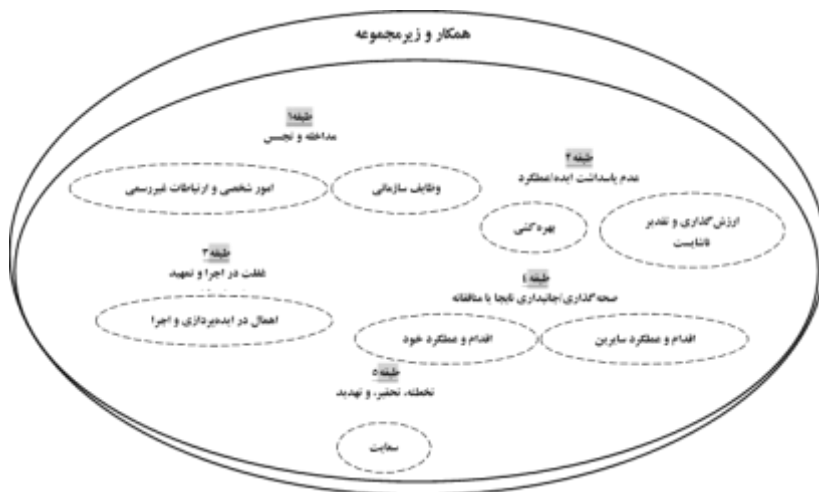
نگاره ۲: فضای نتیجه کژکارکردهای میان فردی بالندگی استعداد‌های سازمانی در افق ارتباطی «همکاران یا زیرمجموعه‌های سازمانی»