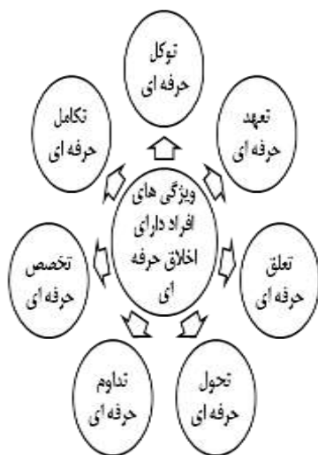
نگاره ۲: ویژگی های افراد دارای اخلاق حرفه ای

در تحلیل اطلاعات بخش دوم پژوهش، جهت کشف وضعیت مطلوب اخلاق حرفه ای از روش مصاحبه با صاحب نظران با شیوه مصاحبه نیمه ساختار یافته که شیوه مناسب جهت جمع آوری اطلاعات در تحقیقات مرتبط با اخلاق می باشد استفاده شد. در این پژوهش محقق در حین مصاحبه دانسته های خود را کنار گذاشته، هدف مصاحبه را برای مصاحبه شوندهگان به روشنی توضیح داده و نکات یک مصاحبه موثر از جمله برخورد دوستانه، جلب اعتماد را رعایت نموده است. مصاحبه از تعداد ۳۰ نفر از متخصصین و صاحب نظران شامل: ۱- تعداد ده نفر از اساتید دانشگاه با سابقه در زمینه اخلاق ۲- تعداد ده نفر از مدیران با بیش از ده سال سابقه کار ۳- تعداد ده نفر از کارشناسان منابع انسانی با بیش از ده سال سابقه انجام شد و مدت زمان انجام مصاحبه به طور میانگین ۴۰ - ۳۵ دقیقه برای هر نفر بود. و از آن جایی که هدف پژوهش تدوین الگوی مطلوب اخلاق حرفه ای می باشد سوالات مصاحبه با عناصر اخلاق حرفه ای (ویژگی های افراد دارای اخلاق، ابزار پیاده سازی، نقش آموزش و فناوری اطلاعات، روش های دستیابی به حد مطلوب و عوامل موثر در بهبود اخلاق حرفه ای، نارساییهای اخلاق حرفه ای، ارزیابی اخلاق حرفه ای) مورد بررسی و تحلیل قرار داده است.