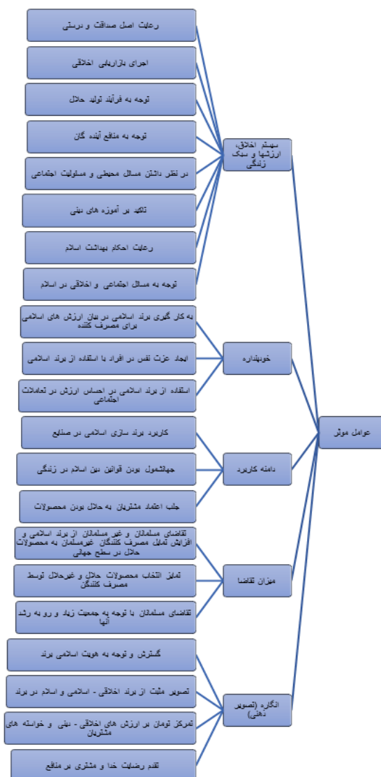
نگاره ۱: ابعاد عوامل مؤثر

سؤال ۲: عوامل مؤثر برندسازی اخلاقی- اسلامی برای ورود به بازارهای بین المللی در کسب و کارهای کوچک و متوسط صنایع غذایی کدامند؟