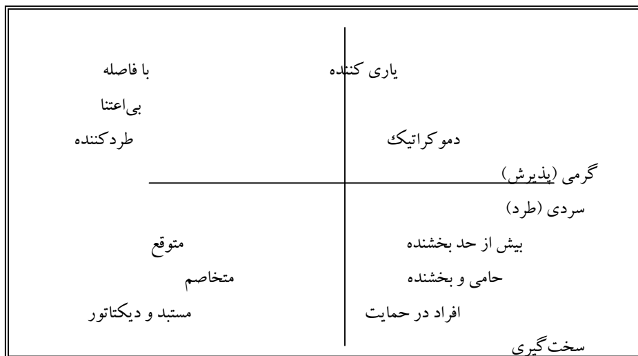
شکل (۲) - شیوه‌های فرزندپروری شیفر (اقتباس از ماسن، ۱۳۷۷)

آزادی - کنترل (سهل گیری در مقابل سخت گیری) و سردی - گرمی (پذیرش در مقابل طرد) ارائه نمود. او نتیجه گرفت که مادران پذیرنده یا طردکننده می توانند سخت گیر یا آسان گیر باشند. این دو بعد اساساً اشاره به سطوح حمایت عاطفی دارد که والدین در مورد کودکانشان به کار می برند و نیز اشاره به کنترلی دارد که والدین در مورد کودکان خود اعمال می کنند. بدین ترتیب از ترکیب این دو بعد، الگوهای مختلف رفتار والدین شکل می گیرند. به طور کلی بسیاری از رفتارهای والدین می توانند در چنین مدل چهاربعدهای قرار گیرند (یعقوبخانی غیاثوندی، ۱۳۷۲).