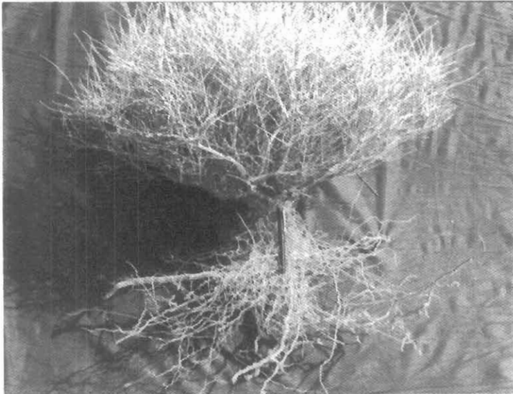
شکل ۱- فرم بوته‌ای و سیستم ریشه E. ceratoides L. در منطقه استپی موته