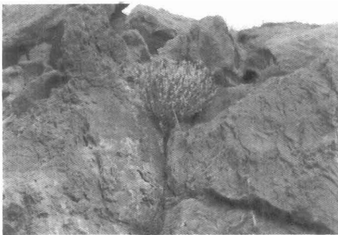
شکل ۲- E. ceratoides L. داخل درز سنگها با خاک بسیار اندک