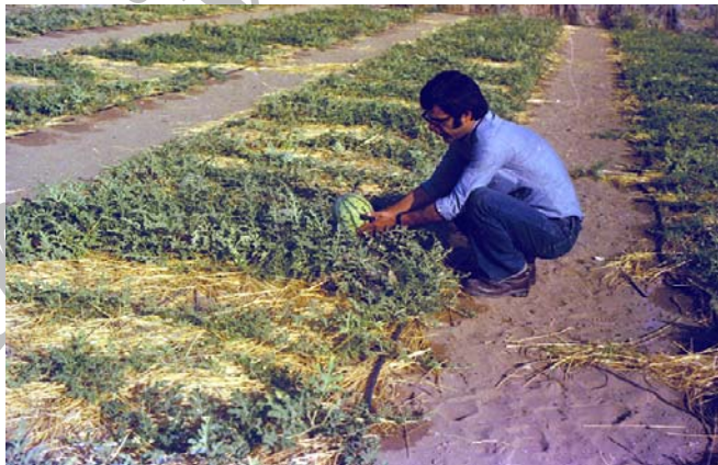
عکس شماره ۳- شروع برداشت محصول هندوانه رقم ژاپنی

آماری مشخص با تعداد تکرارهای لازم امکان‌پذیر نبود. برای مقایسه نتایج حاصل از عملکرد محصولات در تیمارهای مورد آزمایش (وجود یا عدم وجود لایه غیر قابل نفوذ و تیمارهای آبیاری)، طول خطوط کشت هر محصول به ۵ قسمت مساوی تقسیم شد و محصول بدست آمده از هر قسمت به‌عنوان یک تکرار آزمایش در نظر گرفته شد. به‌عبارت دیگر تکرارهای آزمایش در درون تیمارها در نظر گرفته شد بنابراین هر گونه خطای احتمالی در نتایج این تحقیق می‌تواند از انتخاب اجتناب‌ناپذیر این روش آزمون ناشی شده باشد. گرچه آزمون ساده مقایسه میانگین تیمارهای مورد بررسی (برای بیشتر تیمارها اختلاف محصول بسیار زیاد بود) برای این تحقیق می‌توانست گویای یک نتیجه‌گیری نسبی برای تیمارهای برتر باشد، لیکن همان‌گونه که ذکر شد تجزیه واریانس با آزمون F انجام گردید.