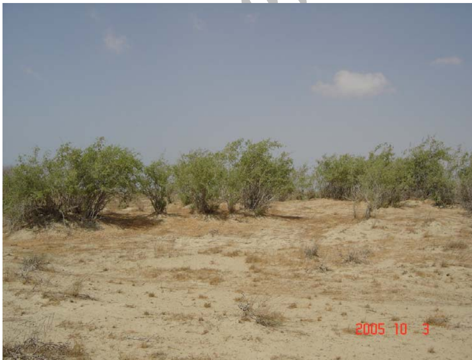
عکس ۲- پایه‌هایی از Salvadora persica با سرسبزی و شادابی در دوره خشکی به علت فتوسنتز خاص