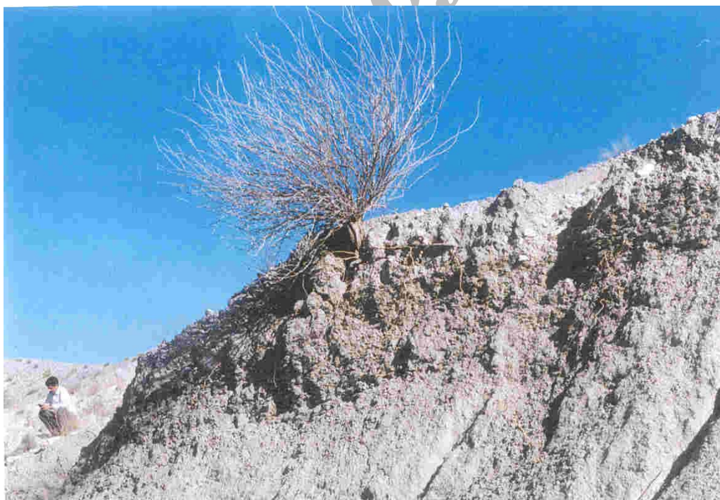
عکس ۴- خزان کامل گونه Zygophyllum atriplicoides و آب کشیدگی اندام‌های هوایی گیاه