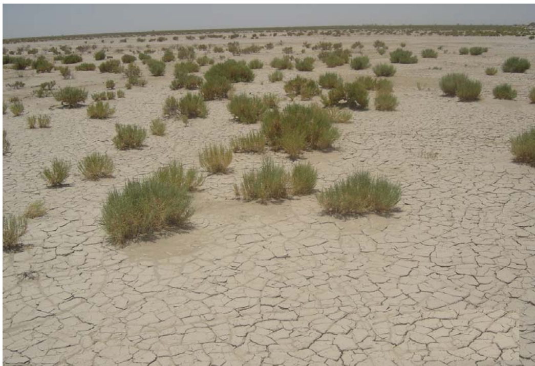
عکس ۳- پایه‌هایی از گونه شورپسند Halocnemum strobilaceum با اندام‌های گوشتی در دوره خشکی