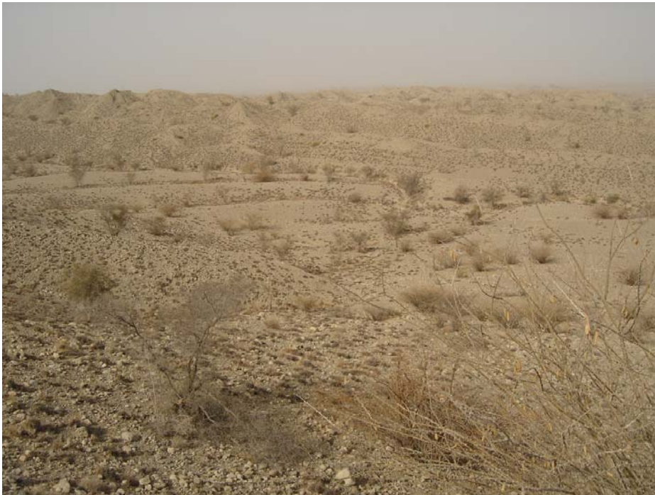
عکس ۱- Acacia ehrenbergiana و Acacia oerfota و خزان پایه‌ها در دوره خشکی