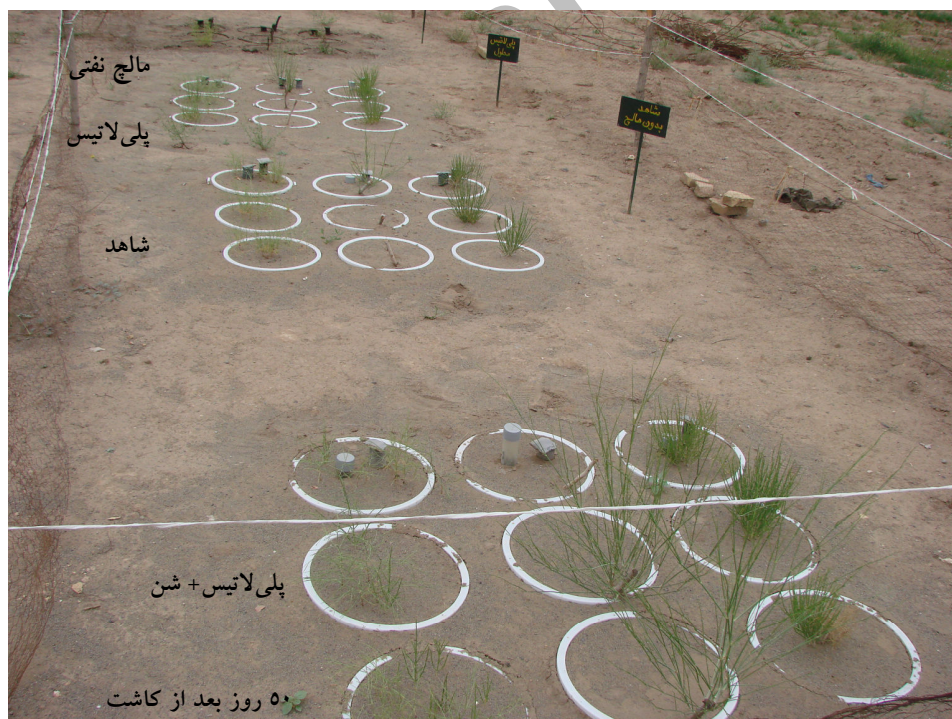
شکل ۳ - نمایی از نحوه کاشت بذرها، تاغ، نهالهای تاغ و قلمه‌های اسکنبیل سبز شده بعد از ۷ هفته از کاشت

نفتی به میزان ۱۰ تن در هکتار (معادل یک میلیمتر ضخامت در واحد سطح)، پلی لاتیس محلول در آب به میزان ۱۰ تن محلول یک درصد در هکتار (ضخامت پاشش به عمق یک میلیمتر)، مخلوط پلی لاتیس - شن به ضخامت ۲-۳ میلیمتر و شاهد (بدون استفاده از هر گونه خاکپوش) در سه تکرار در گلدانهای پلاستیکی با قطر دهانه ۴۵ سانتیمتر و ارتفاع ۵۰ سانتیمتر به عنوان کرت‌های آزمایشی اجرا گردید. تنها محل خروج آب از گلدانها به صورت بخار آب از طریق تبخیر از سطح مالچ پاشی شده و از طریق یک سوراخ ریز در ته گلدان برای خروج آب تغلی بر روی چهار تیمار و سه تکرار انجام گردید. خاک گلدانها از ماسه بادی منطقه صحرایی اجرای طرح انتخاب