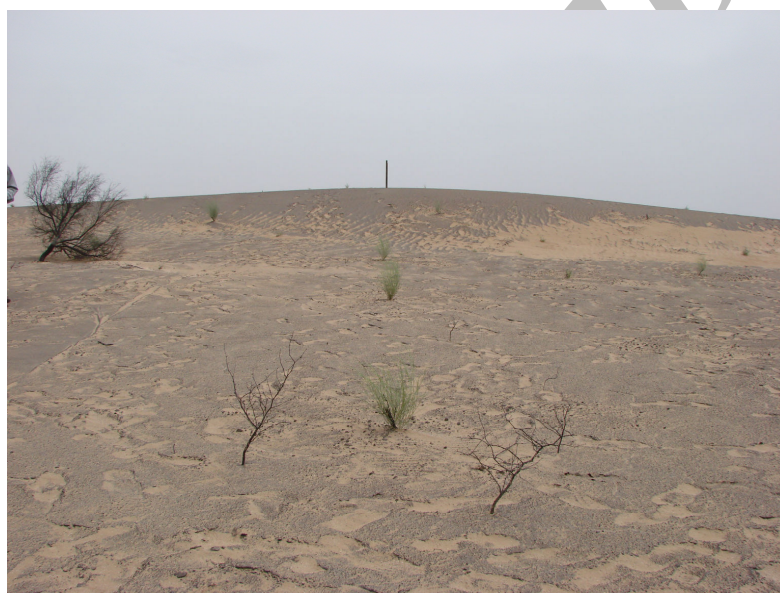
شکل ۴- نمایی از یک عرصه مالچ‌پاشی شده و خشکیدگی پایه‌های موجود در عرصه

علت تأخیر در سبز شدن نهال‌های تاغ در تیمار مالچ نفتی به میزان ۵۰ روز و سبز نشدن کلیه قلمه‌های اسکنبیل در این تیمار را می‌توان به اثرهای منفی مالچ نفتی روی بافت‌های زنده نسبت داد. شکل ۴ نمایی از یک عرصه مالچ‌پاشی شده برای تثبیت شن است که تا حدی دارای پوشش طبیعی اسکنبیل است و به خوبی خشکیدگی ناشی