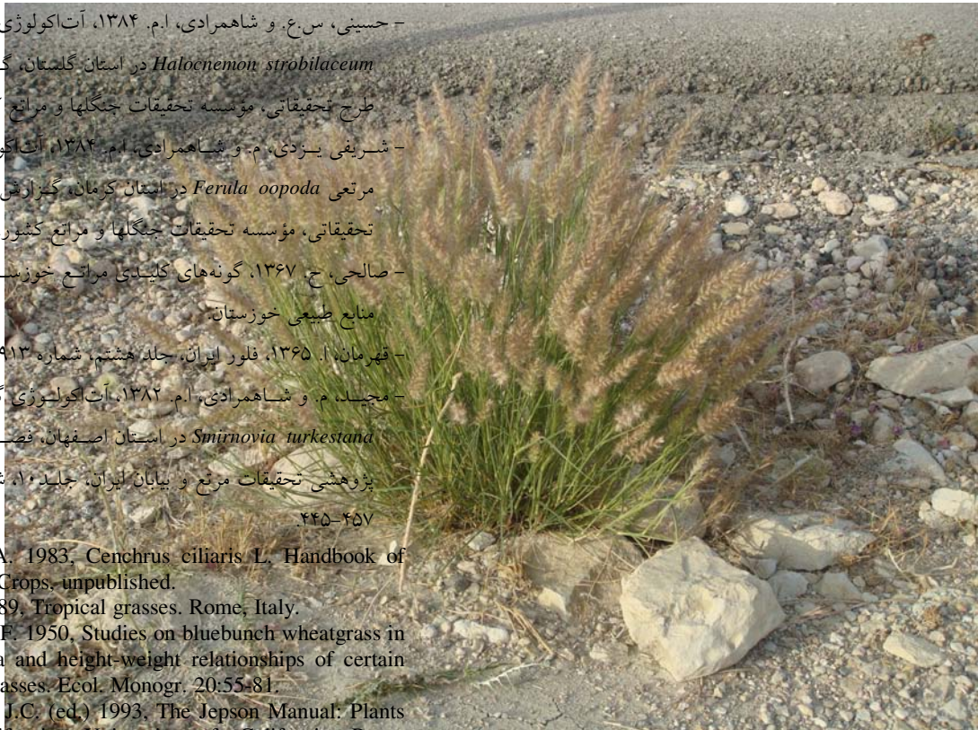
شکل ۳- گونه مرتعی مورد مطالعه خورنال Cenchrus ciliaris در یکی از گراسهای دائمی و مرغوب مراتع جنوب