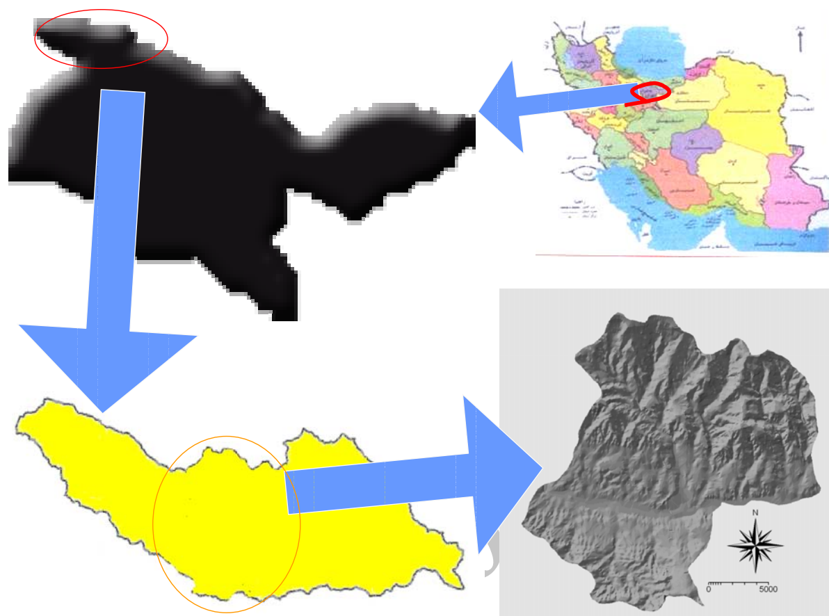
شکل ۱- موقعیت جغرافیایی منطقه طالقان (زیرحوزه سنگیان - جوستان)

مرحله اول شامل جمع‌آوری آمار و اطلاعات موجود در مورد اقلیم، خاک، پوشش گیاهی و سطح زیرکشت محصولات و تهیه نقشه‌های منطقه و مشخص نمودن متغیرهای موردنظر و انتخاب طرح آماری مناسب بود. چون در بخش کشاورزی هم خاک سطحی و هم خاک تحت‌الارضی اهمیت دارد و حدود ۷۵٪ ریشه گیاهان در ۵۰ سانتی‌متر اول خاک قرار گرفته، بنابراین مطالعات برای عمق سطحی ۱۰-۰ سانتی‌متر و عمق تحتانی >10 انجام شد تا وضعیت تغییرات در خاک مشخص شود.