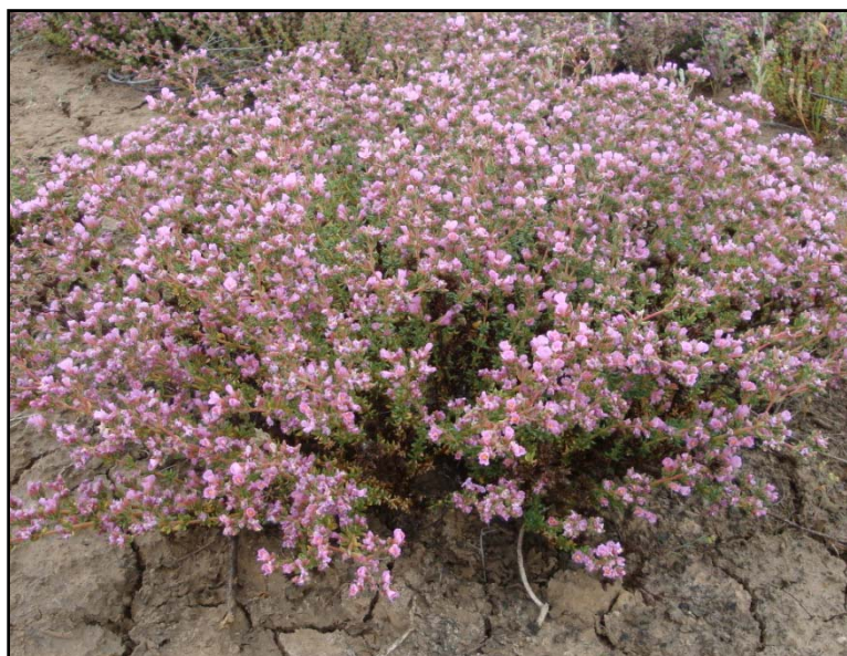
شکل ۳- نمایی از گلدهی یک بوته Frankenia hirsuta در مورخ ۱۳۸۹/۳/۱۲

ولی بهترین زمان استفاده گوسفندان از این گونه، اواخر اسفند و اوایل فروردین ماه است. نتایج بررسی کیفیت علوفه گونه F. hirsuta نشان داد که تفاوت معنی دار در میزان پروتئین خام، ماده خشک و خاکستر گیاه وجود دارد. میزان پروتئین خام در مرحله رویشی برابر با ۱۰/۳ درصد و در مرحله بذردهی ۷/۱ درصد بود، که با افزایش سن گیاه از میزان آن کاسته شد (شکل ۴) و بعکس درصد ماده خشک و خاکستر با افزایش سن گیاه افزایش پیدا کرد (جدول ۴).