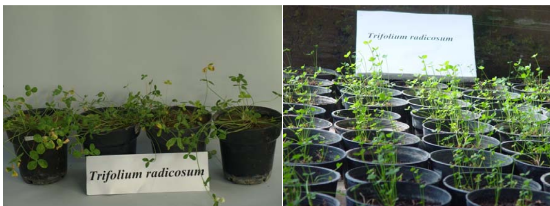
شکل ۳- تکثیر گیاه T. radicosum از طریق کلون ریشه در شرایط گلخانه

تکثیر غیرجنسی گیاه در شرایط گلخانه به منظور حفظ و حراست از این گیاه (صرف نظر از مباحث فراسرد)، یافتن روش مناسب برای تکثیر و تولید گیاه کامل بسیار مهم می باشد. با توجه به مشکلات فراروی تولید گیاه کامل از طریق بذر، با انجام آزمایش های گسترده،