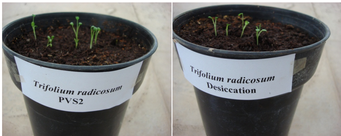
شکل ۲- استقرار بذر و گیاهچه های Trifolium radicosum بعد از یکسال ماندگاری در ازت مایع، در شرایط گلخانه

در ازت مایع نگهداری گردیده اند تفاوت قابل توجهی نشان نمی دهند. به طوری که بیشترین درصد استقرار مربوط به تیمار