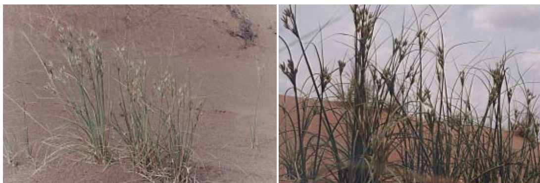
شکل ۶ - گیاه Stipagrostis karelini در مرحله بذردهی

خواب تابستانه زودتر شروع شده، در نتیجه دارای دوره طولانی‌تری نسبت به دوره مشابه خود در سال‌های پرباران می‌باشد. به منظور تعیین ترکیبات شیمیایی، نمونه‌هایی از اندام‌های هوایی گیاه در ۲ منطقه گود ذهاب و سیازگه در دو مرحله گلدهی و بذر، تهیه و آنالیز گردید. نتایج حاصل از آنالیز ترکیبات شیمیایی در جدول ۲ نشان می‌دهد که در مرحله گلدهی و رسیدن بذر مقادیر کلسیم و پتاسیم کاهش، مقادیر منیزیم و ازت و بدون تغییر و میزان پروتئین افزایش می‌یابد.