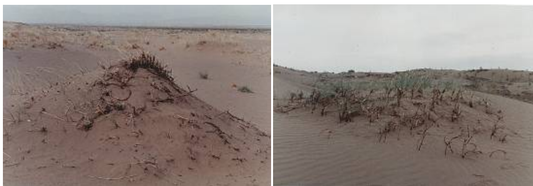
شکل ۴- فرسایش بادی و نمایان شدن ریشه‌های گیاه سیط کاشانی

برای مبارزه با خشکی هوا، مرحله خواب تابستانه را آغاز می‌کند. این مرحله حدود ۲ ماه از اواخر تیرماه تا پایان شهریورماه که کاهش دما را شاهد هستیم، ادامه دارد. پس از آن دوباره "گیاه رشد پائیزه خود را شروع می‌کند. در این مرحله که معمولاً تا پایان آبان بطول می‌انجامد گیاه تولید جوانه‌هایی را از محل یقه و محل بندهای روی ساقه‌های به ظاهر خشک آغاز می‌کند. این جوانه‌ها تا مرحله تولید برگ و ساقه هوایی و حتی اندام‌های زاینده فعالیت کرده ولی با فرارسیدن سرمای آخر پائیز که با کاهش درجه حرارت بین ۲-۴ درجه سانتی‌گراد همراه است، فعالیت آنها کاهش یافته و بذرهای حاصل از رشد پائیزه قبل از رسیدن کامل بعلت فرارسیدن سرمای زمستان به مرحله تکامل نمی‌رسد. پس از این مرحله گیاه وارد مرحله خواب زمستانه می‌گردد و تا اواسط اسفند ادامه می‌یابد (شکل ۵).