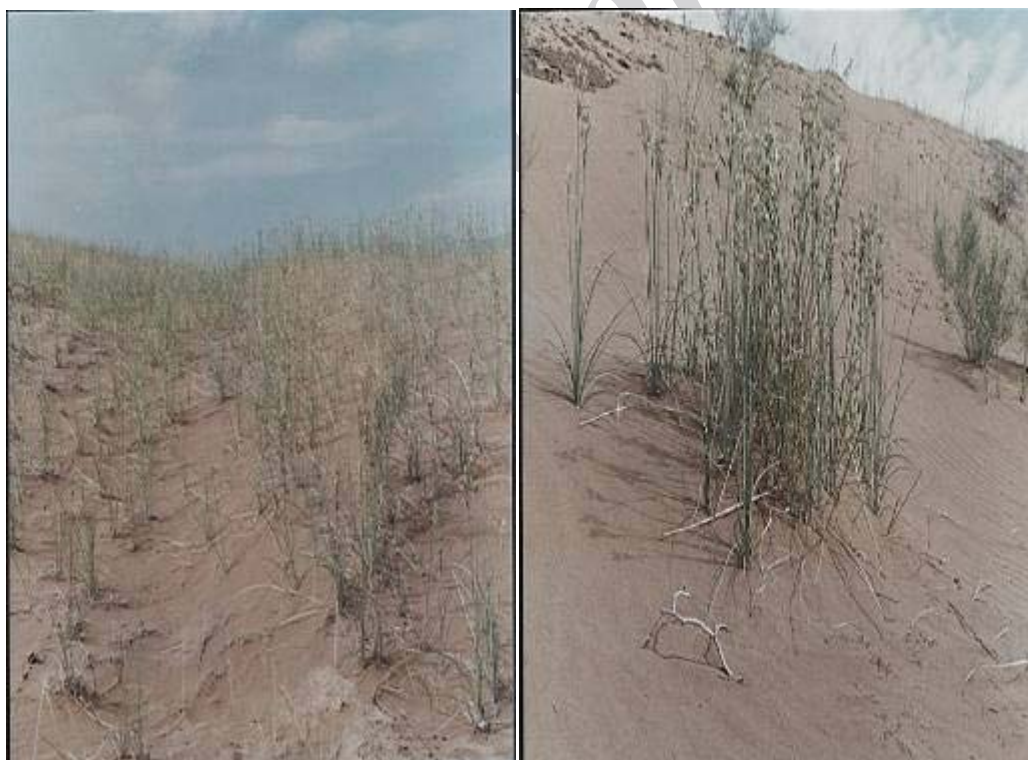
شکل ۲- رویشگاه Stipagrostis karelini در ریگ بلند کاشان