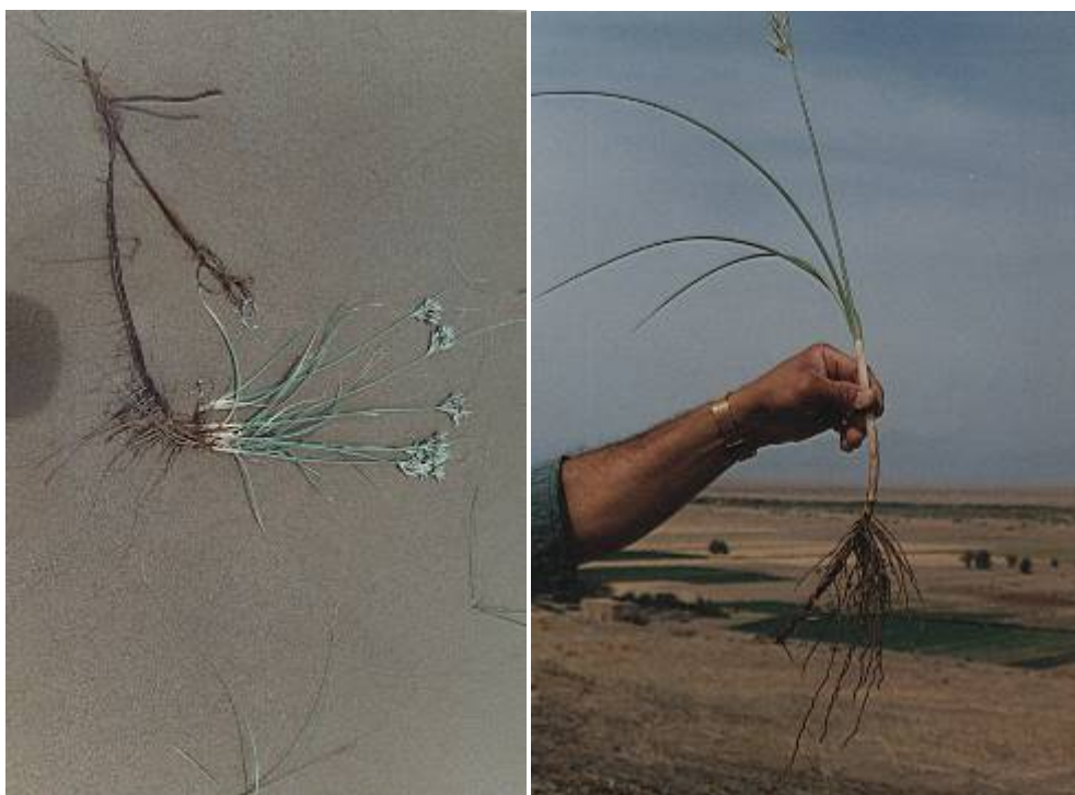
شکل ۳- فرم و اندازه ریشه در Stipagrostis karelini

مانند: Astragalus squarosus , Calligonum sp. نیز مشاهده می‌شود. نکته مهم و قابل توجه در مورد استقرار Stipagrostis karelini ، سهولت تکثیر و استقرار آن می‌باشد. اگر حداقل رطوبت مورد نیاز در اختیار گیاه قرار گیرد گیاه قادر خواهد بود با تولید جوانه‌های هوایی، نسبت به تولید اندام‌های هوایی و زاینده اقدام کند. در رویشگاه‌های مورد مطالعه گونه‌های زیر بصورت گونه‌های همراه سبط دیده می‌شود: