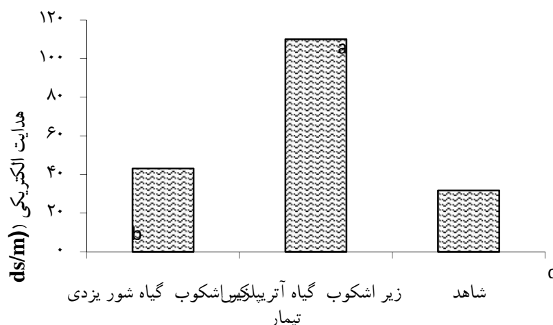
شکل ۳- مقایسه میزان هدایت الکتریکی خاک در سه تیمار مورد بررسی