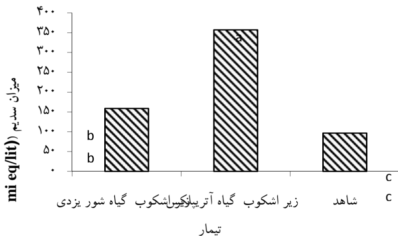
شکل ۲- مقایسه میزان سدیم خاک در سه تیمار مورد بررسی

مقدار سدیم نیز از ۹۶/۳ میلی‌اکی‌والان بر لیتر در تیمار شاهد به ۱۵۸/۷ میلی‌اکی‌والان بر لیتر در گیاه شور یزدی و ۳۵۷/۵ میلی‌اکی‌والان بر لیتر در زیر اشکوب گیاه Atriplex lentiformis میزان هدایت الکتریکی از ۳۱/۷ دسی‌زیمنس بر متر در تیمار شاهد به ۴۲/۹ دسی‌زیمنس بر متر در گیاه شور یزدی و ۱۱۰/۹ دسی‌زیمنس بر متر در زیر اشکوب گیاه Atriplex lentiformis و مقدار ماده آلی از ۶۵ درصد به ۹۱ درصد در گیاه شور یزدی و ۹۱ درصد در زیر اشکوب گیاه Atriplex lentiformis رسیده است. بر اساس