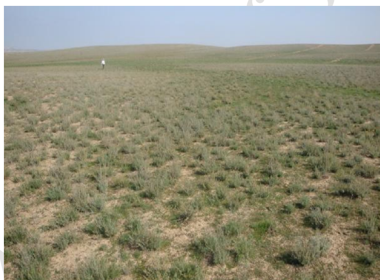
شکل ۳- تیپ گیاهی درمنه معطر ( Artemisia fragrans ) در مراتع مغان (قشلاقی بران، ۱۳۹۰)