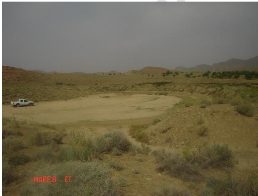
شکل ۳- نمایی از مخزن پشت بند خاکی احداث شده در حوضه

به منظور تعیین محل برای اجرای این مطالعه حوضه دره مرید از زیر حوزه‌های هلیل‌رود در استان کرمان انتخاب و سعی در جمع‌آوری گزارش‌ها و نقشه‌ها و پیشنهادهای اجرایی شد. طی بازدیدهای صحرایی که از حوضه بعمل آمد، محل‌هایی که برای عملیات بیولوژیکی