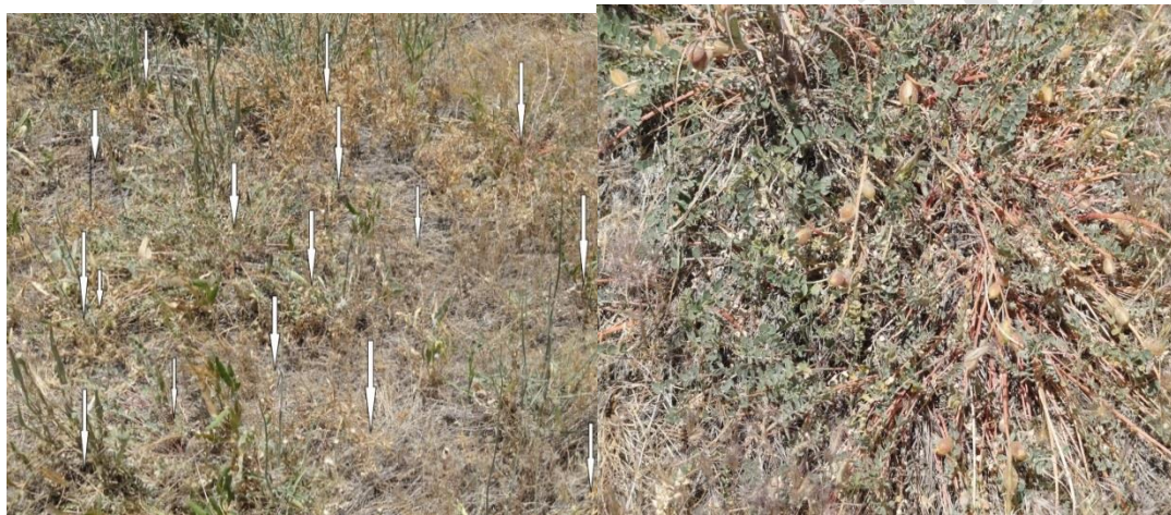
شکل ۷- گونه در مرحله استقرار در محل اجرای پروژه