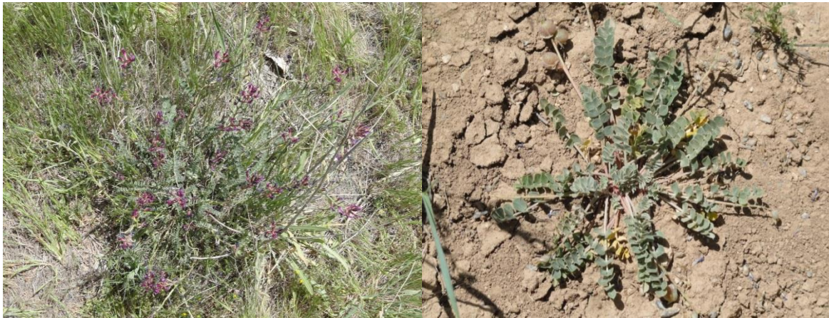
شکل ۵- گونه در مرحله گل‌دهی