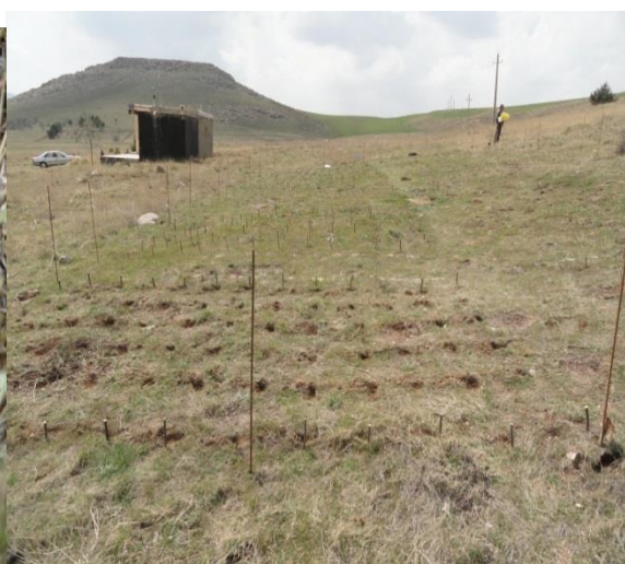
شکل ۲- تصویر آماده سازی زمین و اجرای تیمارها