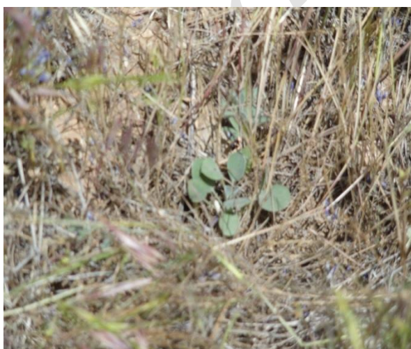
شکل ۳- گونه کشت شده در مرحله رشد رویشی (سال دوم)

بذرهای تهیه شده در قالب دو تیمار بذرکاری و بذرپاشی و دو فصل پاییزه و بهاره و در قالب طرح آماری با پایه اسپلیت پلات با تیمار اصلی فصل کاشت و تیمار فرعی روش کشت