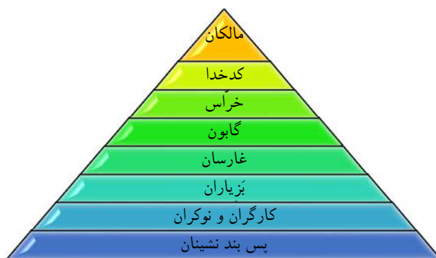
شکل ۲- ساختار اجتماعی دشت گزیر قبل از اصلاحات ارضی

آب دشت گزیر، به صورت کیفی و بر پایه تحقیقات پیمایشی و تاریخی است که محقق از فنون غیرانفعالی مانند مصاحبه، مشاهدات مستقیم و همچنین مشاهده مشارکتی استفاده کرده است؛ به نحوی که طبق پیشنهاد کشاورزان خبره به سراغ سایر کشاورزان مطلع به دانش بومی و ابتکارات محلی رفته و تحقیق خود را تکمیل نموده است و در نهایت به مشترکاتی در رابطه با دانش بومی آب رسیده است. همچنین مصاحبه‌های نیمه‌سازمان‌یافته و سازمان‌نیافته ابزارهای جمع‌آوری اطلاعات در این تحقیق می‌باشد که بعد از مشاهده با ارزش‌ترین وسیله بررسی در این تحقیق است (Azkia & Darban Astane, 2003).