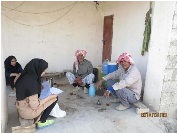
شکل ۶- مالک و بزّیار در دشت گزیر (۱۳۹۶/۱۱/۵)

اکنون این قشر از لحاظ جمعیت مهمترین و تعیین‌کننده‌ترین قشر در نظام کشاورزی دشت گزیر است.