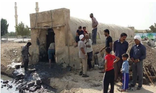
شکل ۷- مِمَشیم بُرکُو در دشت گزیر (۱۳۹۶/۱۱/۴)

۳) مِمَشیم بُرکُو (لایروبی آب انبار): لایروبی آب انبارها با توجه به حجم ذخیره‌ای آن و هر دو یا سه سالی یکبار با خودیاری اهالی دشت انجام می‌شود. در گذشته کدخدا از اهالی منطقه دعوت می‌کرد تا در مکانی تجمع کنند و سهم هر خانوار را برای لایروبی مشخص می‌کرد. در نهایت اگر شخصی توانایی انجام این کار را نداشت از فرد دیگری درخواست می‌کرد تا کار او را انجام دهد و کارگر نیز در قبال کارش دستمزد می‌گرفت. امروزه مسئولیت کار کدخدا را اعضای شورا در روستا انجام می‌دهند و مثل قبل سهم هر خانوار در لایروبی بُرکُو تعیین می‌شود، هرچند این کار به صورت داوطلبانه انجام می‌شود. ساخت، مرمت و لایروبی بُرکُو ترکیب و همگامی خودیاری و انواع دگریاری است، بخشی از کار که به دلیل استفاده خود اهالی بوده را خودیاری و بخش دیگر که به علت عابران و تأمین آب مورد نیاز مناطق اطراف (بندر کنگ و بندر لنگه) بوده است، دگریاری به شمار می‌آید.