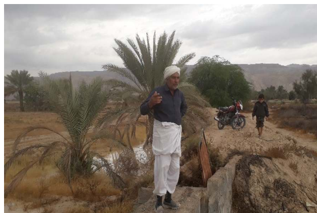
شکل ۴- خراس دشت گزیر که مورد قبول اهالی این دشت است (۱۳۹۶/۹/۲)

ج) زمانی که حقه‌دار و زمین‌داران قصد پرداخت زکات داشتند، طبق آنچه خراس تعیین می‌کرد بخشی از محصول خود را زکات می‌دادند. این نوع خراسی هنوز هم رواج دارد، زیرا کشاورزان اعتقاد دارند که باید زکات آب استفاده شده را به‌صورت محصول پردازند تا محصولشان پربرکت شود. در این روش خراس هر بو (واحد شمارش نخل) نخل را خراسی می‌کند و درنهایت مقدار زکات پرداختی تعیین می‌شود.