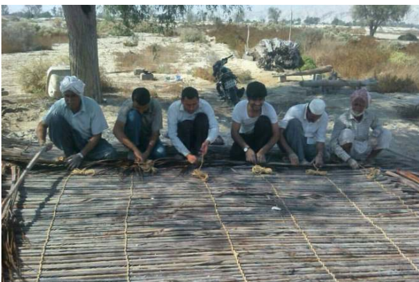
شکل ۸- یاریگری کشاورزان در سِوِنْدُ گِرِتُو (برای کَپر)

۱۰) همیاری در سِوِنْدُ گِرِتُو: سِوِنْدُ نوعی از صنایع دستی دشت گزیر است که برای بستن دریاچه‌های عُلگه، پوششی برای سقف کُتوک استفاده می‌شود. سِوِنْدُ با همیاری حدوداً پنج مرد (زارع و کارگر) از پیش (برگ نخل) و به کمک پَنگ نخل (خوشه نخل) بافته می‌شود. سِوِنْدُ در اندازه‌های کوچک‌تر نیز با همکاری دو نفر بافته می‌شود که برای بستن دریاچه‌های عُلگه استفاده می‌شود. در حال حاضر استفاده از سِوِنْدُ به منظور بستن دریاچه‌های عُلگه کاربرد کمتری دارد و از درهای فلزی یا چوبی استفاده می‌شود.