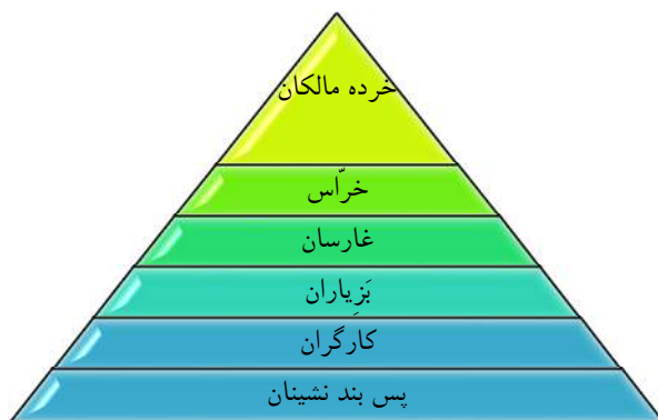
شکل ۳- ساختار اجتماعی دشت گزیر بعد از اصلاحات ارضی

ارضی تشخیص داده می‌شود: الف) قشر حقا به و زمین‌دار، ب) قشر نسق‌دار و ج) قشر بدون حقا به، زمین و نسق.