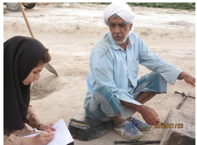
شکل ۵- یکی از غارسان پرتلاش دشت گزیر (۱۳۹۶/۱۱/۵)

به نقل از ریش‌سفیدان دشت گزیر «مشاهده شد که تعداد کمی از مالکان برای اجر اخروی حَقابه، زمین و نهال را در اختیار غارس می‌گذاشتند اما در ازای آن از محصول برداشتی چیزی دریافت نمی‌کردند». این نوعی دگریاری ناهمترانه از گونه فروپاری می‌باشد که طبق صحبت‌های ریش‌سفیدان هنوز هم این امر مشاهده می‌شود.