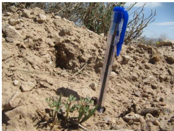
شکل ۸- سبز شدن بذرهای کاشت پاییزه در بهار سال دوم

میانگین ستون‌هایی که دارای حروف مشابه هستند بر اساس آزمون دانکن اختلاف معنی داری با هم ندارند.