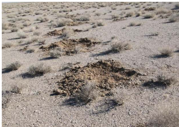
شکل ۴- احداث هلالی آبگیر در منطقه اجرای طرح

حدود ۴ درصد بوده است، درحالی که موفقیت کشت پاییزه در این سال مشابه سال قبل بوده است. میانگین درصد سبز شدن بذرها در روش های مختلف کاشت در سال ۹۲ تفاوت