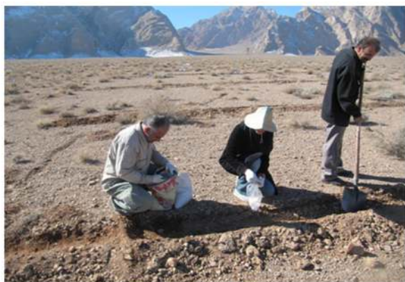
شکل ۶- کاشت بذر گونه Ferula tabasensis