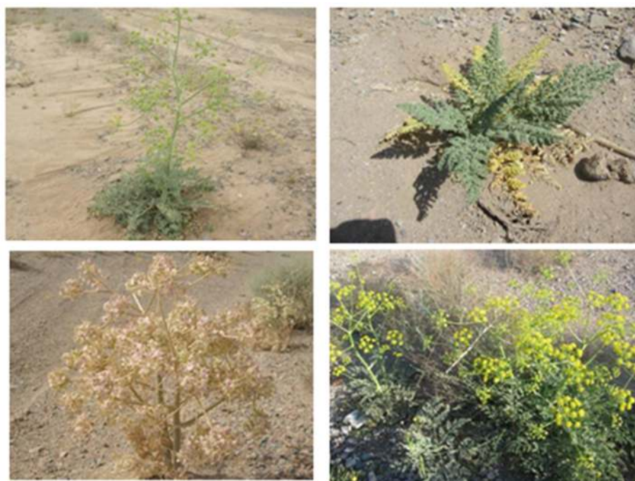
شکل ۱- گونه Ferula tabasensis در مراحل مختلف رشد

در تحقیقی شاخص‌های تنوع و غنای گونه‌ای در مراتعی که در آن عملیات مکانیکی اصلاحی هلالی‌های آبگیر انجام شده بود، در مراتع نارون شهرستان خاش استان سیستان و بلوچستان بررسی شد. نتایج نشان داد که کلیه شاخص‌های تنوع در منطقه اصلاحی با منطقه شاهد اختلاف معنی‌داری دارند، ولی بین شاخص‌های غنا در دو منطقه اختلاف