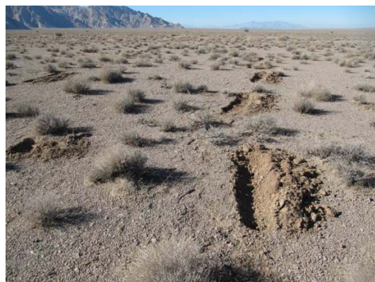
شکل ۵- احداث پیتینگ در منطقه اجرای طرح