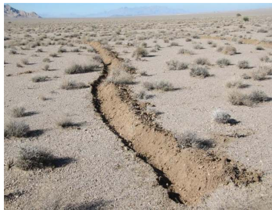
شکل ۳- احداث فارو در منطقه اجرای طرح