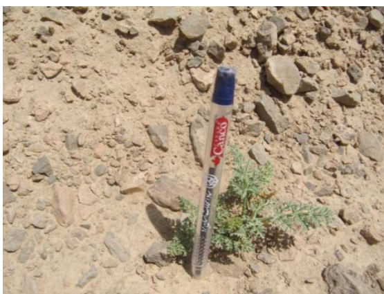
شکل ۷- استقرار پایه ناشی از کشت پاییزه ۹۲ در سال ۹۵