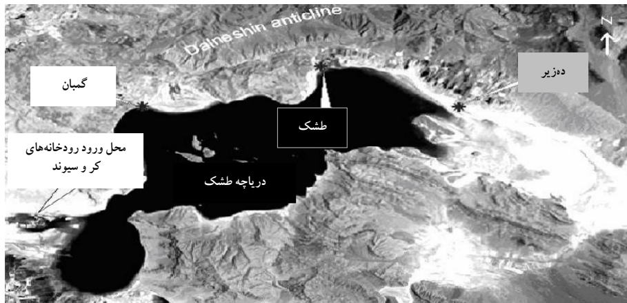
شکل ۱- نقشه ماهواره‌ای ایستگاههای نمونه برداری شده

با جدول M.P.N میزان احتمالی کلیفرم مدفوعی در ۱۰۰ میلی لیتر نمونه آب تعیین شد [۶].