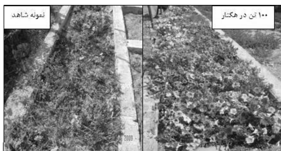
شکل ۲- مقایسه مراحل رشد گیاه در خاک شاهد و تیمار ۱۰۰ تن در هکتار بعد از ۱۲۰ روز (ماه پنجم)