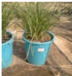
شکل ۱- شکل ظاهری گلدان‌های مورد استفاده در کشت گیاه و تیور

برای انجام آزمایش ابتدا انواع کوچکی از گیاه و تیور از مجموعه تحقیقاتی مجموعه پارس جنوبی تهیه شد. بلافاصله پس از خریداری، گیاه در گلدان‌هایی با خاک معمولی دانشکده (با بافت سیلتی لوم) در فضای آزاد و زیر سایبان (به دلیل گرمای زیاد و آفتاب شدید) با سایه ۵۰ درصد کشت داده شد تا گیاه مورد نظر با شرایط محیط سازگاری پیدا کند و از تابش شدید نور مستقیم آفتاب در امان باشد. گیاهان پس از کاشت به مدت ۳۰ روز با آب معمولی تا حد ظرفیت مزرعه آبیاری شدند تا با شرایط گلدان و خاک جدید سازگاری لازم را پیدا نمایند (جدول‌های ۳ و ۴). برای انجام آزمایش، گیاه مورد نظر برای اعمال تیمارها، به ۳۲ گلدان بزرگ به قطر ۷۰ و ارتفاع ۱۲۰ سانتی‌متر منتقل شد (شکل ۱).