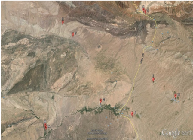
شکل ۱- پراکندگی جغرافیایی و موقعیت ایستگاه‌های آلوده به آرسنیک در منابع آبی شهر ریوش

نظر جغرافیایی، مختصات نقاط دارای آرسنیک که با استفاده از دستگاه GPS به دست آمده بر روی نقشه توپوگرافی در محیط Google Earth وارد شد (شکل ۱).