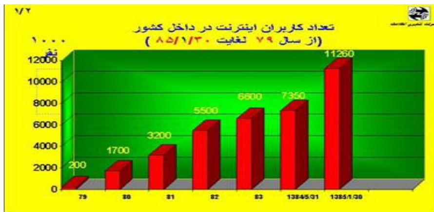
۲- نمودار رشد کاربران اینترنت در ایران از سال ۷۹ تا ۸۵

۲۰۰۶ حدود یک میلیارد و پنجاه میلیون نفر ذکر شد (Internet world statistics) و برای سال ۲۰۰۹ تعداد کاربران یک میلیارد و چهارصد میلیون نفر پیش بینی شده‌اند (Travel.com). آخرین آمار مربوط به جمهوری اسلامی ایران حاکی از آن است که تا پایان فروردین ماه ۱۳۸۵، تعداد کاربران اینترنت از مرز یازده میلیون نفر عبور کرده‌است (هفته‌نامه بزرگ‌تره فناوری).